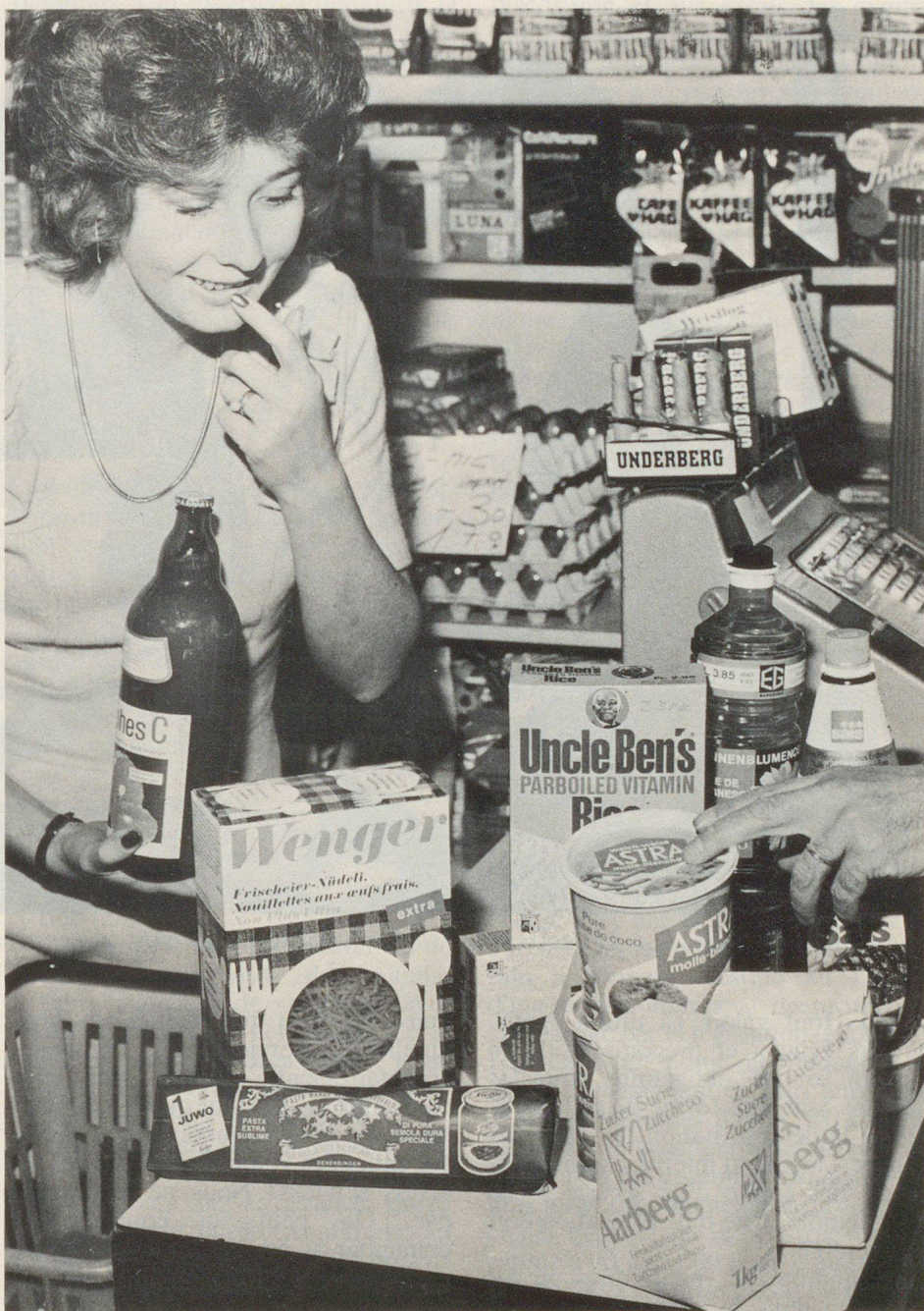
La femme est la gérante des réserves de secours et assume sa part de responsabilité pour la survie de notre peuple.

L'histoire de la collaboration de la femme à la défense nationale a été marquée peu avant la Deuxième Guerre mondiale par le décret de l'ordonnance sur le service complémentaire et l'admission de femmes dans ce