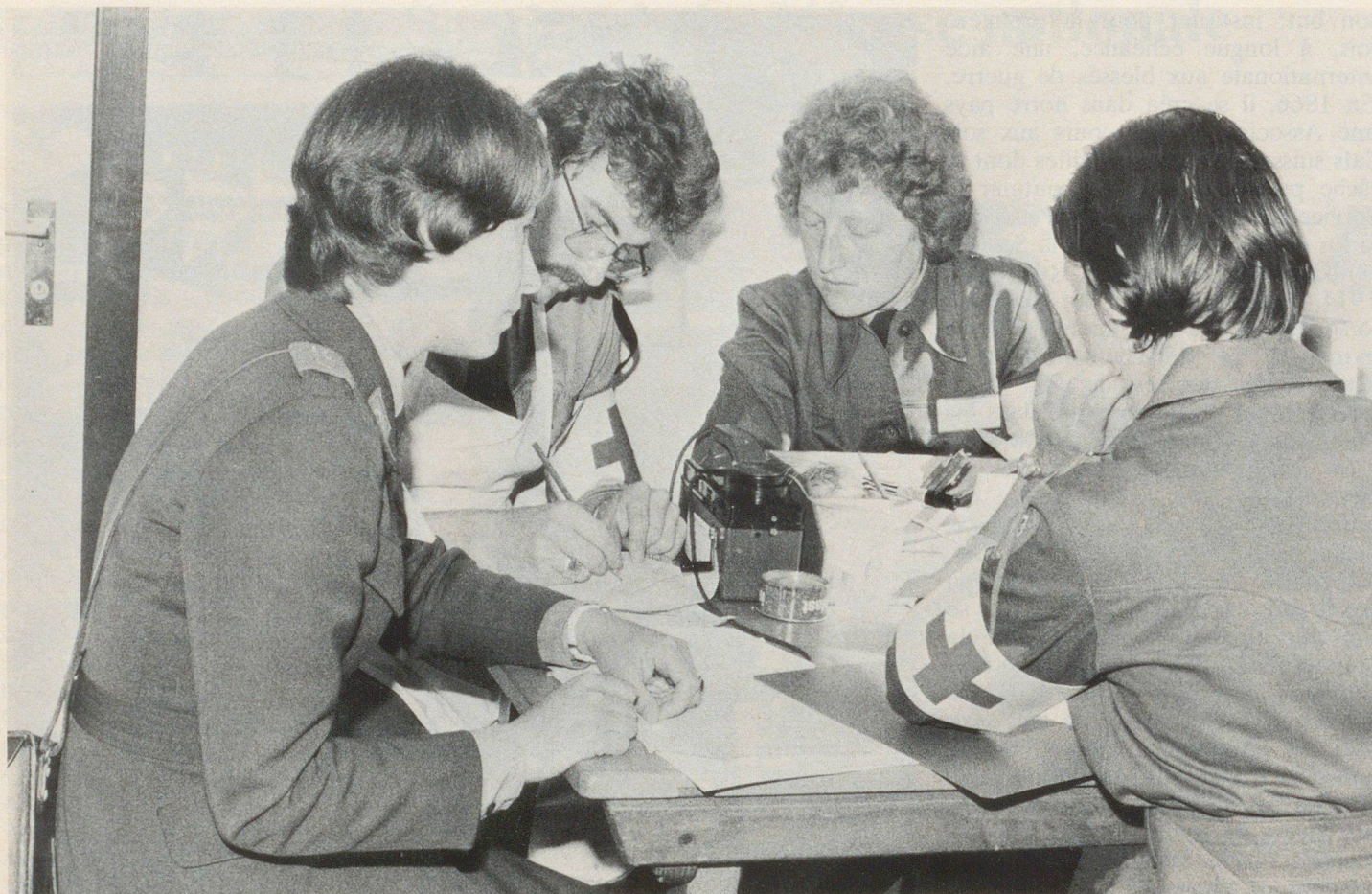
Des membres du Service de la Croix-Rouge de l'armée suivent un cours de complément.

milieux font valoir «à droits égaux, devoirs égaux» et préconisent de ce fait un service obligatoire pour les femmes, soit sous forme de collaboration à la défense nationale, soit pour d'autres tâches d'intérêt communautaire, sous forme d'un service social par exemple. Une telle obligation doit être rejetée.