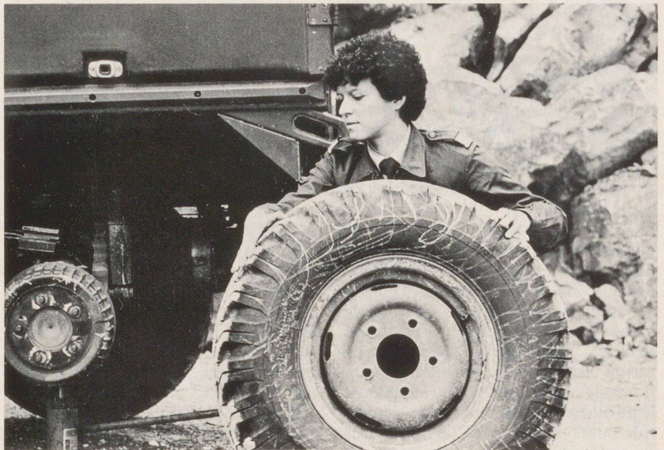
Le service complémentaire féminin de l'armée compte également un service de véhicules à motorisés.

Il est certain que nous ne voudrions pas voir nos femmes porter des armes, bien qu'au cours de notre histoire suisse, il y eut des femmes qui participèrent activement à des combats: par exemple en 1405, lors de la bataille de Stoss à laquelle des femmes armées participèrent dans le but de chasser les Autrichiens. En 1798, des Bernoises se battirent à Grauholz contre les Français, aux côtés des hommes. En 1292, des Zuricoises se rendirent sur le Lindenhof, pour y retenir le duc Albrecht d'Autriche qui s'apprêtait à attaquer la ville de la Limmat. Ces femmes avaient recouru à une ruse en revêtant des cuirasses, faisant croire à l'ennemi qu'une troupe nombreuse s'était rassemblée sur le Lindenhof pour y défendre la ville. Il y aurait