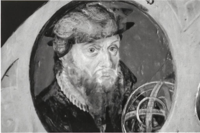
Abb. 6.2 Baret, heller Spitzbart und Halskrause als Unterzeichnungen im ursprünglichen Porträt zu David Chytraeus.

einer Retusche unterworfen worden. Abgesehen davon wurde bei dem im Süden des Heiligen Römischen Reichs weniger bekannten Gesicht lediglich das einst blonde Barthaar umgefärbt, um einen orientalischen beziehungsweise südländischen Effekt zu verstärken (siehe dazu Abb. 6.2). Die ursprüngliche Darstellung dieses