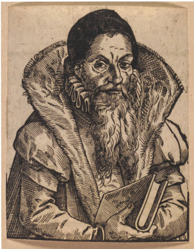
Abb. 6.3 Holzschnitt mit zeitgenössischem Porträt zu David Chytraeus, Tobias Stimmer zugewiesen, nach 1586. 10 × 8 cm. Westfälisches Landesmuseum, Porträtarchiv Diepenbroick, Inv.-Nr. C-594274 PAD.

Reformators der zweiten Generation ist bildsprachlich vergleichbar mit der prominenten Erwähnung von Wittenberg und Rostock als gegen Norden ergänzte gleichwertige Klimabezeichnungen am Meridianring (die übrigen Klimaangaben folgen dem ptolemäischen Kanon). 25 Der so erhobene Anspruch für Rostock als «Wittenberg des Nordens» ist eng an die über Mecklenburg hinaus bekannte Wirkung von David Chytraeus geknüpft.