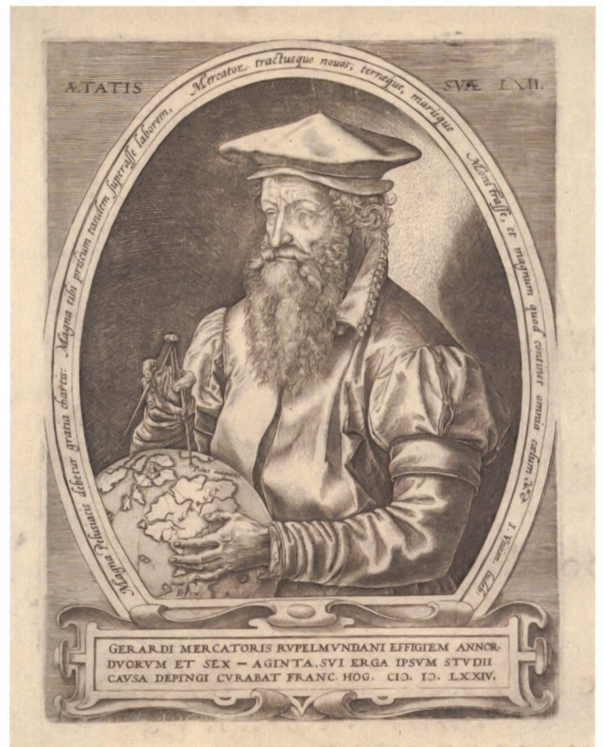
Abb.3.3 Holzschnitt mit zeitgenössischem Porträt zu Gerhard Mercator von Frans Hogenberg nach Hendrik Goltzius, 1574. Zentralbibliothek Zürich, T 44.

Im Bildarchiv des Schweizerischen Nationalmuseums wird eine Fotografie der oben zuletzt besprochenen Stelle aufbewahrt. Sie wurde anlässlich der Restau-