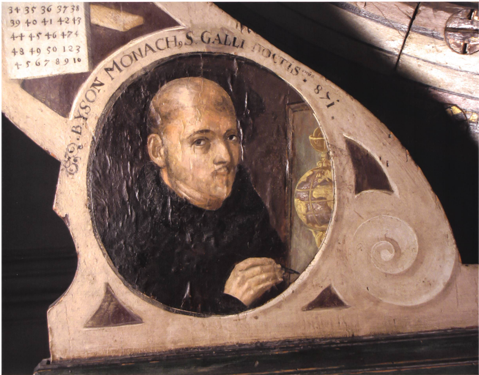
Abb. 7.1 Pergament-Medaillon am Globuskorb mit retuschiertem Porträt von Johann VII. von Mecklenburg (1595 dem frühmittelalterlichen St. Galler Mönch Iso umgewidmet). St. Galler Globus (Original). Schweizerisches Nationalmuseum.

schen Hof im letzten Viertel des 16. Jahrhunderts fortzuführen. Die Darstellung passt zu einem empfindsamen Gemüt, wie es der durch Selbstmord früh verstorbene Herzog Johann VII. (1558–1592) offenbar besass. Ein Porträt Johanns von 1582 auf einer Medaille 30 der Staatlichen Münzsammlung in München (Abb. 7.3) zeigt auf den ersten Blick wenig Ähnlichkeit mit dem durch Übermalung modifizierten und heute sichtbaren Porträt am St. Galler Globus. Dies ändert sich beim Vergleich der Medaille mit der radiografischen Aufnahme (Abb. 7.2). Die Unterzeichnung zeigt eine kostbare (weil stark vertikal gefälte) Halskrause, einen kurz geschnittenen Bart und einen leicht nach oben gewirbelten Schnauz – passend zur Abbildung auf der Medaille. Die inhalt-