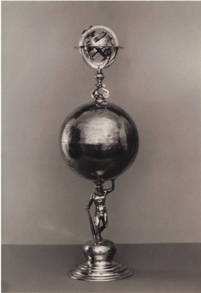
Abb. 8 Globuspokal von Abraham Gessner, um 1590. Historisches Museum Basel, Inv.-Nr. 1882.101.

mund von Johann Albrechts Sohn Johann – wurde eine Sparpolitik eingeführt, die den Beginn eines solchen Globenbaus unwahrscheinlich machte. Viel eher markierte der Tod von Johann Albrecht I. einen Zeitpunkt, als der Globus beinahe fertig war und nicht mehr wie geplant beendet werden konnte. Ein ähnliches Schicksal erlitten nachweislich Stellas Projekte für ein Kartenwerk des Heiligen Römischen Reichs und für einen Kanalbau zwischen Elbe und Ostsee. 31