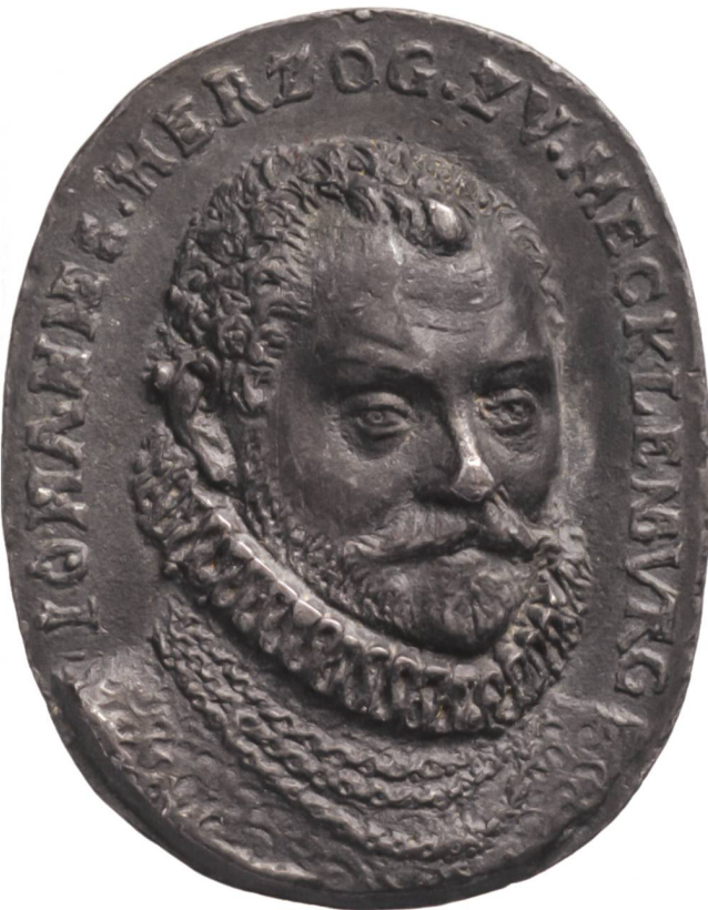
Abb.7.3 Zeitgenössisches Porträt Johanns VII. von 1582 auf einer Medaille. Staatliche Münzsammlung München, Inv.-Nr. 11/1374.

zum herzoglichen Porträt verweist auf den Standort des Globus am Hofe. Der St. Galler Globus richtete sich als Medium zur Vorführung eines herrschaftlichen Selbstverständnisses an Betrachtende, die sich als Besucherinnen und Besucher im Schweriner Schloss aufhielten. Diesen den gastgebenden Herzog namentlich vorzustellen wäre ungehörig gewesen (analog dazu wurden bei der späteren Aneignung in St. Gallen für den Fürstabt nur dessen Wappen und die Jahreszahl ergänzt, nicht aber dessen Namen). David Chytraeus war in Mecklenburg – und besonders an den mecklenburgischen Höfen Güstrow und Schwerin – ein buchstäblich «bekanntes Gesicht». Sein Porträt bedurfte deshalb keiner erklärenden Beschriftung. Der ebenfalls nicht beschriftete Gerhard Mercator wurde den gelehrten Betrachtenden durch die oben beschriebenen Attribute reichsweit eindeutig vorgestellt. Die verhältnismässig dosierten Retuschen, wie sie die anderen Porträts erfuhren, hätten hier für eine Umwidmung nicht ausgereicht – was wohl der Grund war, weshalb dieses Medaillon in St. Gallen komplett übermalt wurde.