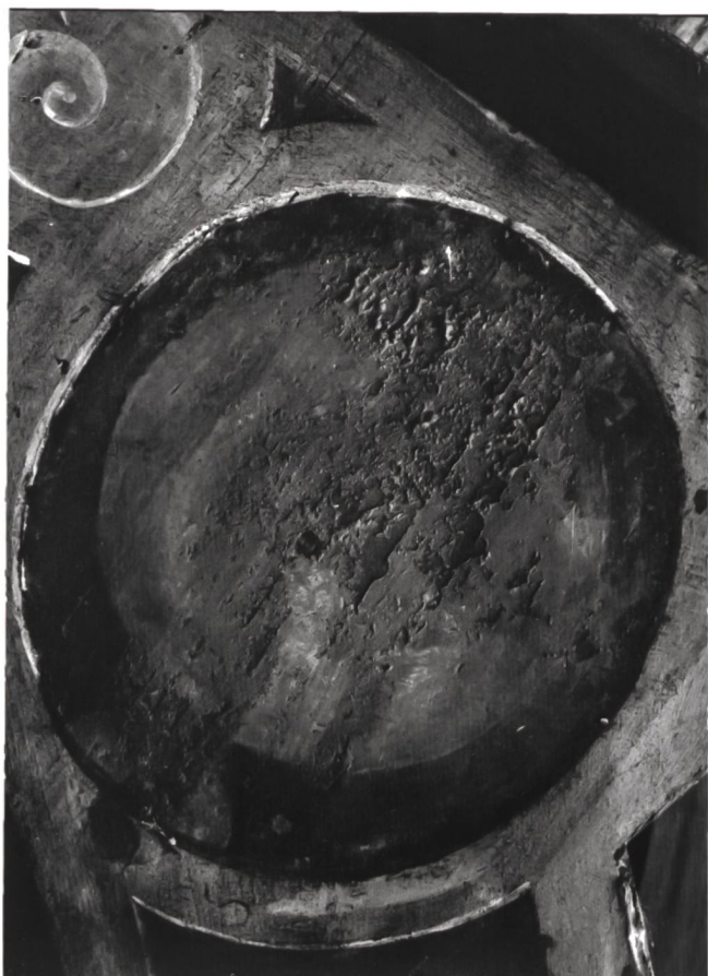
Abb. 5 Medaillon wie bei Abb. 3.1; hier mit abgelöster Pergamentschicht anlässlich der Restaurierung 1961. Auf der damals fotografierten Stelle ist eine abgebrochene Dekormalerei sichtbar. Zu erahnen ist ein Astrolabium mit seinem Haltering (Sockeltisch rechts oben, Bild um 135° verdreht).

fläche zu erkennen. Zusammen mit einer zusätzlich angedeuteten hellen Kreisfläche am oberen Ende des Medaillons (das heisst links unten auf der Fotografie) legt sie den Schluss nahe, dass in diesem Medaillon das malerische Fertigen eines astronomischen Instruments vorzeitig abgebrochen worden war. Es handelt sich bei den Kreisobjekten wohl um die Umriss eines Astrolabiums (Haltering und Scheibe). Diese Kreiselemente sind auch auf der Radiografie gut sichtbar, während bei den anderen Brustbildern mit dieser Technologie keine Malerei zu entdecken ist, die durch die Pergamentmedaillons abgedeckt worden wäre (hätte man Malereispuren entdeckt, als die Medaillons 1961 abgelöst wurden, wären wohl auch dazu Fotografien archiviert worden). Der Abbruch dieser Dekormalerei und die spätere Überklebung mit dem Porträtmedaillon zu Gerhard Mercator lässt auf ein Ereignis schliessen, das einschneidend genug war, um die ursprüngliche Konzeption zur Beendigung der letzten Arbeiten am St. Galler Globus umstürzen zu können – zum Beispiel der Tod des Auftraggebers beziehungs-