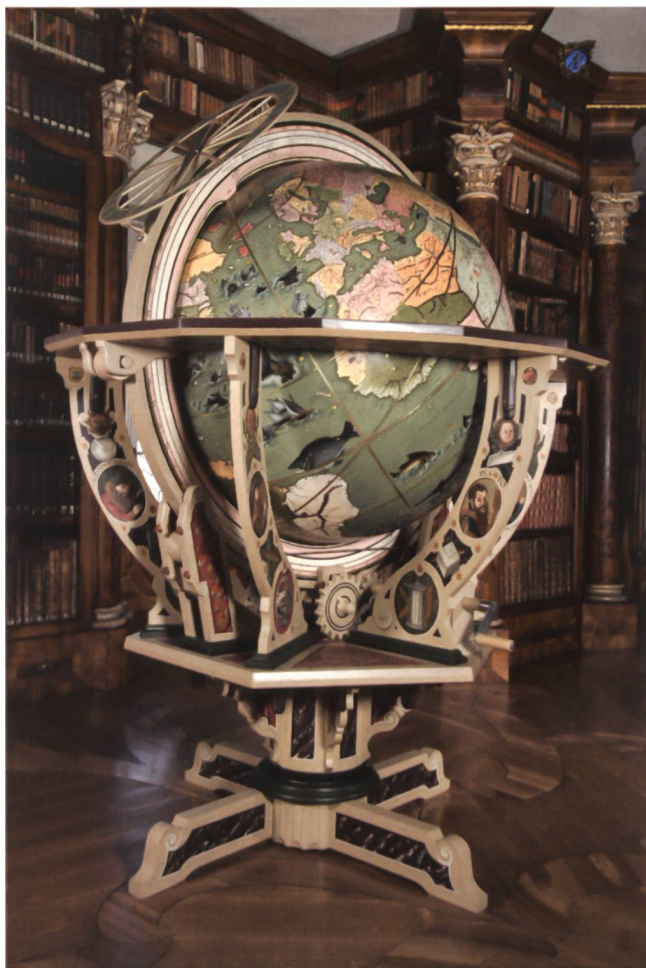
Abb. 1.2 St. Galler Globus (Replik), 2007–2009. Stiftsbibliothek St. Gallen, ohne Inv.-Nr.

an den Kurfürsten August von Sachsen. Stellas Wahl des Holzschnitts als Technik zum Druck der Himmelskarten-Segmente verweist auf eine Serienproduktion. Im Laufe der Replizierungsarbeiten zum St. Galler Globus im Zeitraum zwischen 2007 und 2009 (Abb. 1.2) wurde deutlich, dass verschiedene Fertigungsschritte der Originalkugel weitsichtig und raffiniert vorbereitet waren,