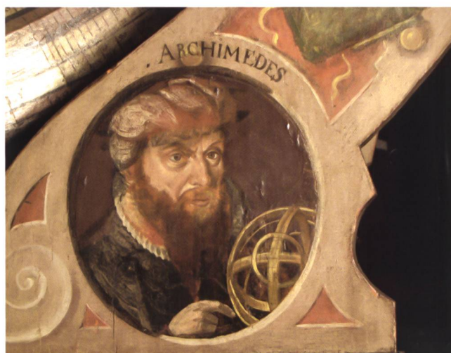
Abb. 6.1 Pergament-Medaillon am Globuskorb mit nachträglich modifiziertem Porträt (von David Chytraeus zu Archimedes). St. Galler Globus (Original). Schweizerisches Nationalmuseum.

Die beiden anderen Brustbilder wurden nicht wie bei Mercator komplett übermalt, sondern erfuhren durch Retuschen eine Umwidmung. Dabei wurden vor allem die Kleidung und die Gesichtsbehaarung übermalt. Die restlichen Attribute, namentlich die Artefakte jeweils rechts im Medaillon, blieben unverändert. Es liegt auf der Hand, dass sich der Fürststab durch die Übermalungen in erster Linie von den ursprünglich dargestellten Zeitgenossen distanzieren wollte. Dies gilt besonders für das Porträtmedaillon, das 1595 retuschiert und mit der Überschrift «Archimedes» ergänzt worden war (Abb. 6.1). Die Zuweisung an den ursprünglich Porträtierten wird durch starke physiognomische Merkmale erleichtert. Der Ausdruck der Augen, die Bögen der Augenbrauen, die Tränensäcke, die beiden Stirnfalten, die fleischige Unterlippe, die aussergewöhnliche Form der grossen, dicken Nase, die Nasenfalten, der herunterhängende Schnurrbart und der gegabelte Spitzbart finden sich in einem zu Lebzeiten gedruckten Porträt des im Zusammenhang mit dem Empfehlungsschreiben an Herzog Johann Albrecht I. bereits erwähnten mecklenburgischen Gelehrten David Chytraeus (1530–1600) wieder (Abb. 6.3). Vor allem die Kopfbedeckung und die Halskrause auf diesem Porträt waren in St. Gallen