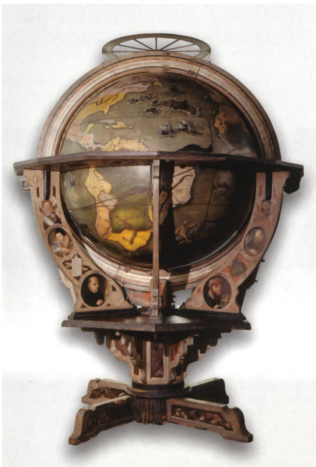
Abb. 2 St. Galler Globus (Original), 1576. Alte Schauseite mit zeitgenössischen Porträtmedaillons unten an den Korbstreben. Depositum der Zentralbibliothek Zürich im Schweizerischen Nationalmuseum, Dep. 846.

Von den unten an den Korbstreben des St. Galler Globus angebrachten Porträtmedaillons waren bisher nur deren zwei bekannt (Abb. 2). Diese sind grösser als die übrigen Exemplare und zudem auf Pergament gemalt, was eine gediegenere Wirkung erzeugt. Sie wurden 1595 kurz nach der Erwerbung durch den Fürststab in St. Gallen retuschiert, um sie dem gelehrten St. Galler Mönch Iso aus dem 9. Jahrhundert (mit Kutte) und dem antiken Archimedes (mit Turban und Umhang) umzuwidmen. 19 Ein weiteres aufgeklebtes Pergamentmedaillon in deren Mitte zeigt astronomische Instrumente auf rotem Grund (Abb. 3.1 und Abb. 9.2).