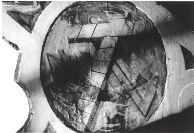
Abb.3.2 Medaillon wie bei Abb.3.1: Unterzeichnung mit einem Porträt von Gerhard Mercator.

Die kartografische Darstellung solcher Inseln fand durch Gerhard Mercator seit 1569 erstmals breite Beachtung. 22 Er hatte sich eingehend mit dem magnetischen Nordpol befasst und in der Folge vorgeschlagen, den Nullmeridian entsprechend zu verlegen. Der Erdmagnetismus bildete ein zentrales Argument seiner Kosmologie, sodass er sich 1573/74 von Hendrik Goltzius als «Mann des magnetischen Pols» porträtieren liess (Abb. 3.3). 23 In besagtem Porträt zeigt Mercator deshalb mit dem unteren Zirkel-Ende auf den magnetischen Pol. Dieser befindet sich – wie beim Porträt am St. Galler Globus – zwischen dem Nordpol und einem Kontinent (Amerika). Die kartografische Darstellung der Polregion mit vier Inseln zusammen mit der Hervorhebung des magnetischen Pols beziehungsweise des Magnetbergs durch einen Stechzirkel war Ende des 16. Jahrhunderts als ikonografische Kombination in einem Porträt einzigartig und verweist eindeutig auf Gerhard Mercator (vermutlich diente eine der seitenverkehrten Nachdrucke dieses Porträts als Vorlage).