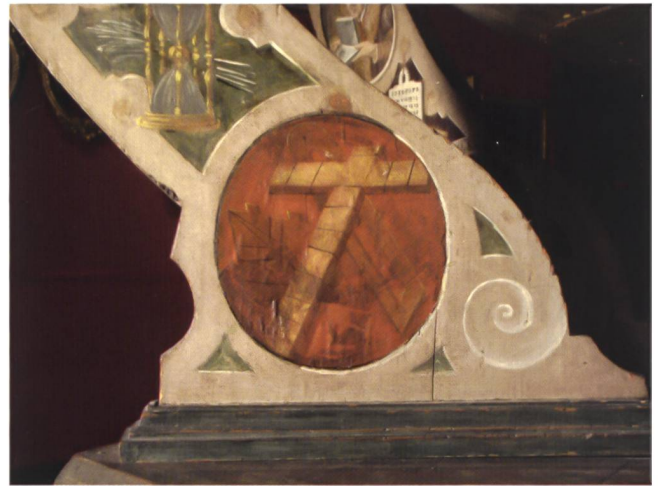
Abb. 3.1 Pergament-Medaillon am Globuskorb mit nachträglich übermalten astronomischen Instrumenten. St. Galler Globus (Original). Schweizerisches Nationalmuseum.

Auf der Suche nach einem während des Aneignungsprozesses in St. Gallen überklebten oder übermalten Herkunftshinweis wurden im Frühling 2016 alle Korbstreben monochromatisch und radiografisch untersucht. Die Radiografie erfolgte mittels einer mobilen Röntgenröhre (Abb. 9.1) und offenbarte bei den beiden unten sichtbaren und bereits bekannten Brustbildern Baretts und kostbare Halskrausen, wie sie als selbstständige Kleidungsstücke ab den 1570er Jahren in Mode gekommen waren. 20