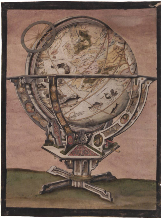
Abb. 1.1 Verkaufsvorschau zum St. Galler Globus, 1592/1595. 59 × 44 cm. Zentralbibliothek Zürich, Wak R 25.

Diese aufwendige Verkaufsvorschau lenkt den Blick über den einst in Augsburg 2 vermuteten Ursprung des Globus hinaus: Innerhalb des süddeutschen Raums hätte sich ein Gewährsmann des Fürststabs (oder dieser selbst) besser persönlich ein Bild von diesem sehr kostspieligen