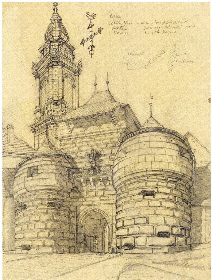
Abb. 3 Solothurn, Eichthor (Baseltor), von Johann Rudolf Rahn, 3./5. April 1892. Bleistift laviert, 30,4 × 22,7 cm. Zentralbibliothek Zürich, Rahn XII, 40.

Moderne Bautechnik – so Geymüller – könne den « caractère individuel » des bestehenden Turmes bewahren. Er drängte auf eine Überarbeitung des Projekts durch Viollet-le-Duc 61 – die Intervention blieb jedoch erfolglos.