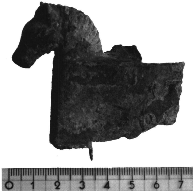
Abb. 3 Wagenaufsatz aus Lellig-Berbourg.

aus der Belgica bislang nicht sicher überliefert; gleichwohl dürften solche existiert haben. So könnte ein Relief aus Senon (Frankreich) einst zu einem Wagnergrabmal gehört haben; im oberen Bereich ist ein Joch und darunter der Kopf eines Bärtigen zu sehen, der mit einer Arbeit beschäftigt zu sein scheint. 19