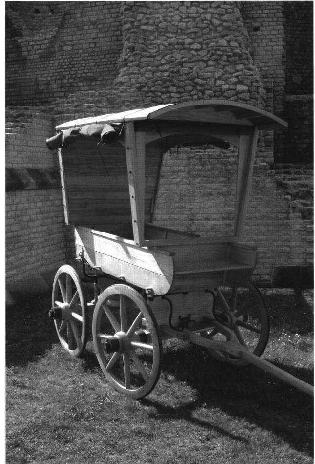
Abb. 4 Augster Reisewagen, Rekonstruktion.

ohne die Stellmacher. Allerdings war ein mit Metallteilen versehener Wagen stabiler und je nach Gestaltung repräsentativer. In Feddersen Wierde existierten im 2. Jahrhundert n. Chr. zwei Werkstätten für Speichen- und Scheibenräder in der Nähe einer Schmiede. In den vici des Rhein-Maas-Gebietes waren die Handwerkszweige neben-