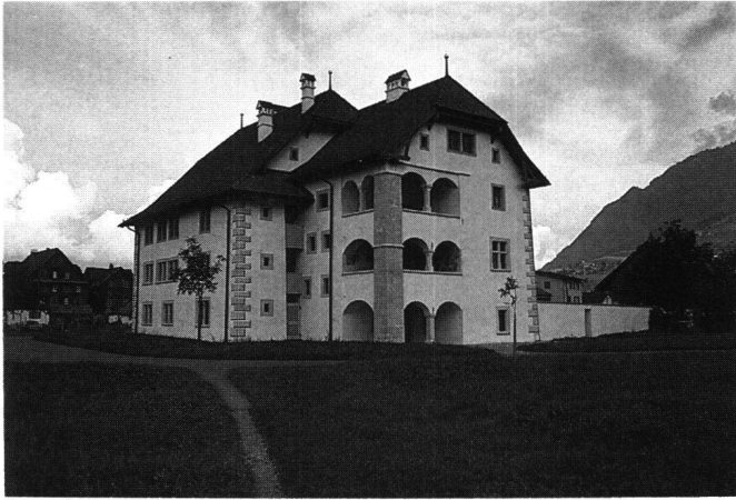
Abb.5 Stans/NW, Winkelriedhaus. Repräsentativer Wohnsitz, der um 1600 durch Ritter Johann Melchior Lussy aus älterem Kern erweitert und umgestaltet wurde.