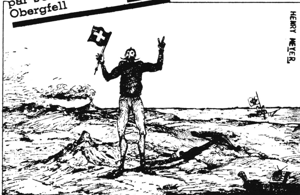
Abb. 2 Welchen Sieg soll Wilhelm Tell 1991 signalisieren? Doch der «Sieg» wird zur Niederlage, da der Freiheitsheld – einsam in einer verwüsteten Umwelt – seine Freiheit verloren hat, gefesselt an seine Armbrust, die er am Fuss mit sich herumschleppen muss (Karikatur in: Tribune de Lausanne, 5.6.1983).

in nützlicher Frist eine Machbarkeitsstudie zu erarbeiten. Dieses Vorgehen liess den entscheidenden Instanzen jederzeit die Wahl, das Projekt CH 91 gutzuheissen oder abzulehnen.