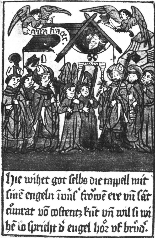
Abb. 1 Christus weiht als Bischof die Einsiedler Gnadencapelle. Holzschnitt, koloriert, 15,4×9,6 cm, Basel, vor 1466; Seite aus dem Blockbuch «Dis ist der erst aneuang...». Einsiedeln, Stiftsarchiv A.DB 5, Seite 49.