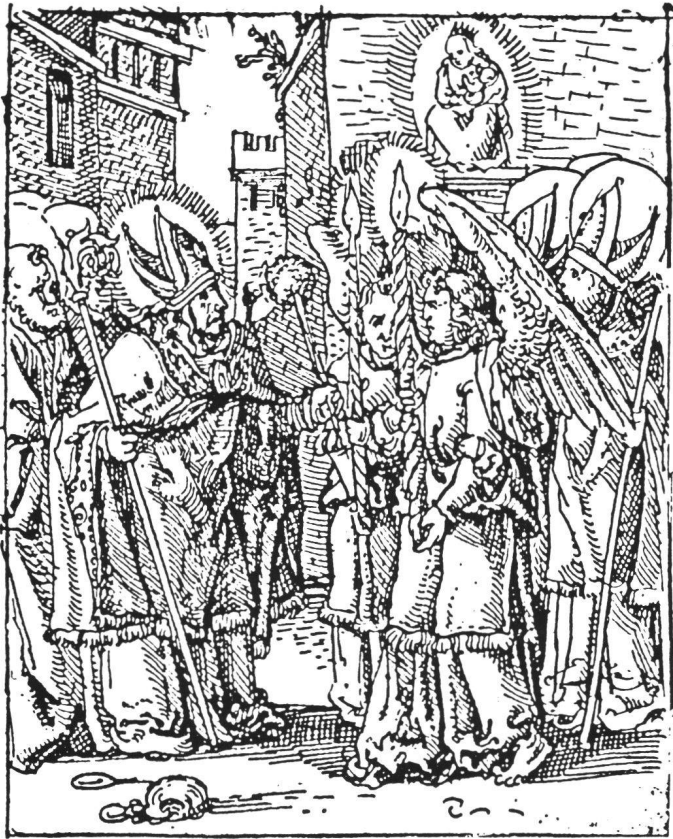
Abb. 6 Christus weiht als Bischof die Gnadenkapelle zu Einsiedeln. Federzeichnung in schwarzer Tusche auf Papier, 11,9×9,5 cm. Unbekannter Zeichner (Nürnberg?, Oberrhein?). 1. Drittel 16. Jahrhundert. Einsiedeln, Stiftsarchiv Ms. A. DB 8, Seite 77.

zen zu können. Die Qualität dieser neuen Buchholzschnitte sollte geeignet sein, auch in den Schichten des hohen Klerus und des Adels für die Einsiedler Wallfahrt zu werben. Vielleicht wollte man dieses schön illustrierte Manuskript auch einem wohlhabenden Stifter vorlegen, um ihn zur Finanzierung neuer Holzstöcke zu bewegen und auf diese Weise eine prächtiger illustrierte Neuausgabe drucken zu können. Offensichtlich sind solche Pläne gescheitert, wohl nicht zuletzt wegen der Krise, welche das Kloster in der Frühzeit der Glaubensspaltung zu überstehen hatte 18 ; so hat man auch für die Neudrucke des 16. Jahrhunderts noch die alten Furterschen Holzstöcke benutzt.