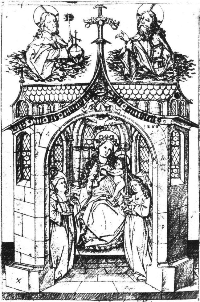
Abb. 9 Kleine Madonna von Einsiedeln. Kupferstich des Meisters E.S., datiert 1466, 13,2×8,8 cm (Einfassung). Stiftung Preussischer Kulturbesitz Berlin, Kupferstichkabinett Museum Dahlem.