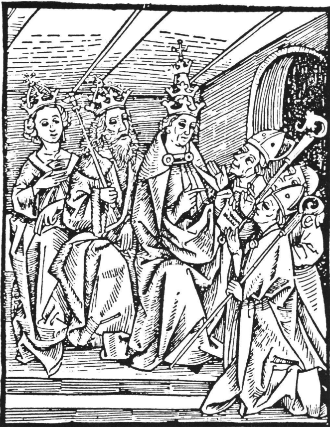
Abb. 4 Papst Leo VIII., Kaiser Otto und Kaiserin Adelheid bestätigen dem Hl. Konrad mit einer Bulle das Wunder der Engelweihe. Holzschnitt, 10,5×8,1 cm. Offizin Michael Furter, 1496. Illustration zur Druckausgabe der Meinradslegende bei Michael Furter, Basel.

Die Furterschen Holzschnitte sind später für eine ganze Reihe von Drucken im 16. und 17. Jahrhundert wiederverwendet worden. 16 Dies lässt vermuten, dass das Kloster selber über diese Holzstöcke verfügt haben muss und diese dann bei der Herstellung einer neuen Druckausgabe der