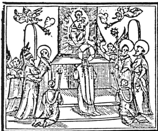
Abb. 8 Christus liest als Bischof die Heilige Messe vor dem Marienaltar der Gnadenkapelle. Holzschnitt, Mailand 1605, 5,3×6,4 cm (innere Einfassung). Illustration zur italienischen Buchausgabe der Meinradslegende aus der Offizin Girolamo Bordonis, Mailand 1605. Einsiedeln, Stiftsarchiv A. Fb 1, Seite 37.

gedient haben, aufgezogen auf einem Holzbrettchen oder auch befestigt auf der Innenseite des Deckels eines Buchkästchens oder einer Holztruhe, während die «Kleine Madonna» (Abb. 9) ein Format aufweist, welches sie zum Einlegen oder Einkleben in ein Gebetbuch geeignet erscheinen lässt.