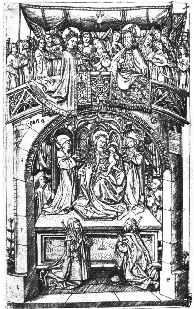
Abb. 10 Die Grosse Madonna von Einsiedeln. Kupferstich des Meisters E.S., datiert 1466, 20,8×12,2 cm (Einfassung). Dresden, Kupferstichkabinett der Staatlichen Kunstsammlungen.

Madonna» (Abb. 10) gehört zu den schönsten Leistungen des Kupferstechers E.S.; an die Stelle der einfachen Kapelle der Holzschritte setzt dieser Stecher ziervolle Architekturgebäude, deren Formengut die Herkunft des Meisters aus dem Handwerk der Goldschmiede zu erkennen gibt. Die Steinmetzzeichen 26 auf beiden Stichen wollen den Eindruck eines wirklichen Bauwerks verstärken, und die zierlichen Kapellen sollten wohl für milde Gaben der Pilger für den Wiederaufbau der Kirche nach dem schweren Brand des Vorjahres werben. 27