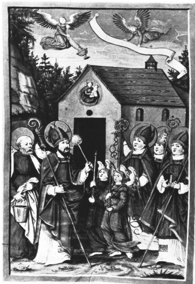
Abb. 7 Christus weiht als Bischof die Gnadenkapelle zu Einsiedeln. Miniatur, Tempera auf Pergament, 27,3×17,6 cm. «Buch der Stifter und Gutthäter» von 1588, Seite 4. Einsiedeln, Stiftsarchiv.

Beide Kupferstichblätter sind im Gegensatz zu den frühen Holzschnittdarstellungen der Engelweihe nicht als Buchillustration geschaffen worden, sondern als religiöse Andachtsblätter, als Einzelblätter und Andenken für die Pilger, welche das grosse Engelweihfest von 1466 23 besucht haben. EDITH WARREN HOFFMAN hat nachweisen können, dass die Blätter vermutlich doch vom Kloster Einsiedeln selber in Auftrag gegeben und vertrieben worden sind 24 , wobei der oberrheinische Stecher nicht ein Buch zu illustrieren hatte, sondern eigenständige Kunstwerke geschaffen hat. Vor diesen Blättern konnte das «Ave Maria» gebetet werden, eine im Spätmittelalter beliebte Bussübung, welche mit Ablässen ausgestattet war. Die «Grosse Madonna» (Abb. 10) mochte zuhause in der Stube als Andachtsbild