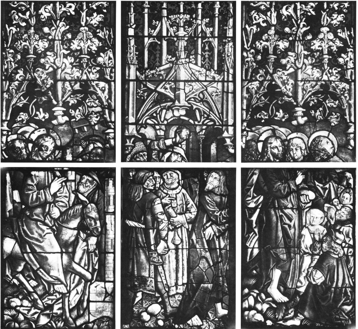
Abb. 2 Ulm, Münster, Chor, Ratsfenster: Einzug in Jerusalem, Steinigung Christi, Speisung der Fünftausend.

Im Augenblick kann diese Liste nicht an einem Missale der Diözese Konstanz, zu der Ulm gehörte, nachgeprüft werden. Die hier aufgeführte Perikopenfolge muss weithin üblich gewesen sein; als ein sehr viel älteres Zeugnis sei hier nur das in Echternach zwischen 1039 und 1042 entstandene, CARL NORDENFALK zufolge schon 1039 vollendete Evangelistar genannt, das seit 1646 der Bibliothek des Bremer Rates gehört. 10 Die genannten Evangelien der fünf Fastensonntage enthält beispielsweise auch das 1549 entstandene «Book of Common Prayer» der anglikanischen Kirche. Die Reihe der Evangelienlesungen lag für sie offenbar schon früh fest, wie die Überlieferung aus karolingischer Zeit zeigt, so das Capitulare Evangeliorum in den Typen Π, Λ, Σ