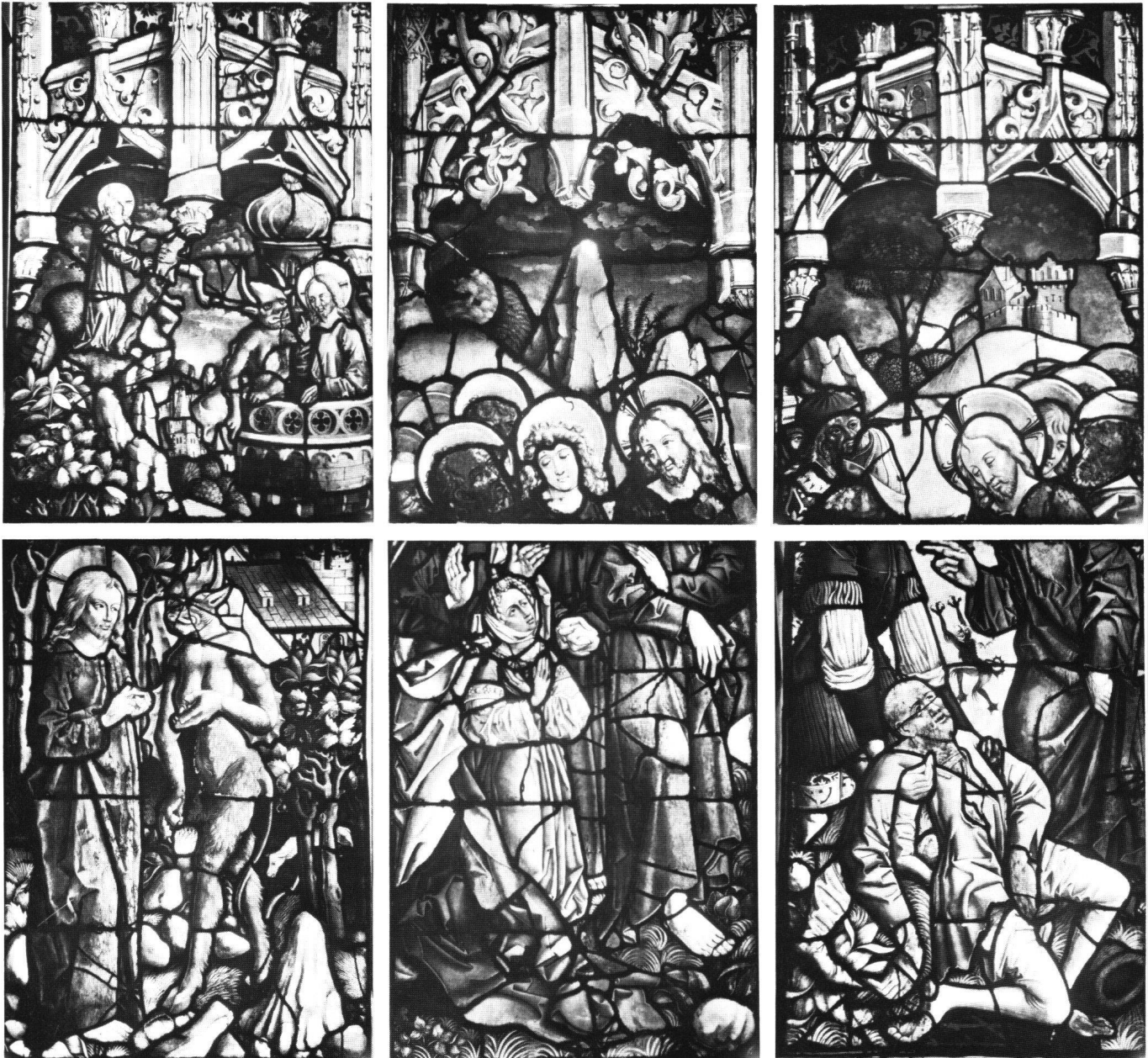
Abb. 1 Ulm, Münster, Chor, Ratsfenster: Versuchungen Christi, Christus und die Chananäerin, Heilung des stummen Besessenen.

nachtridentinischen Missale, ergibt sich eine Folge von vier Sonntags- und zwei Werktagsevangelienlesungen. 9 Die Formulierung von Frick legt aber nahe, dass es sich durchweg um Sonntagsperikopen handelt – die alten Werktags-