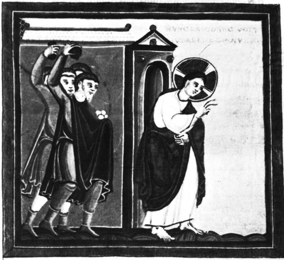
Abb. 4 Bremen, Univ.-Bibl., Ms. b. 21, Echternacher Evangelistar Heinrichs III., fol. 40: Steingung Christi.

locutus est ih̄s in galil̄a n̄o. docens in templo. Et n̄a ap̄ prehendit cum quia nondum uenerat hora eius. ̄o ̄o ̄m̄ .v.