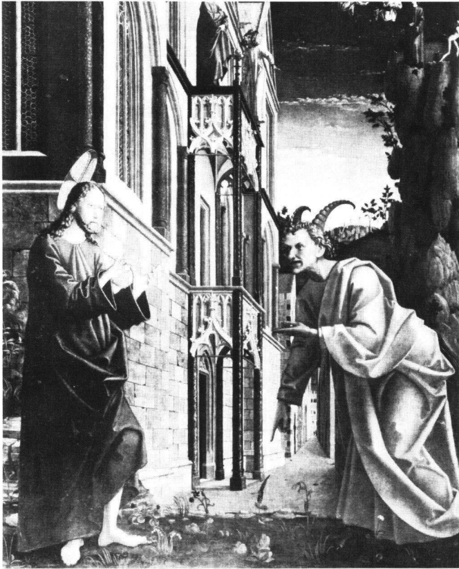
Abb. 7 Michael Pacher, Versuchungen Christi, St. Wolfgang, Hochaltar.