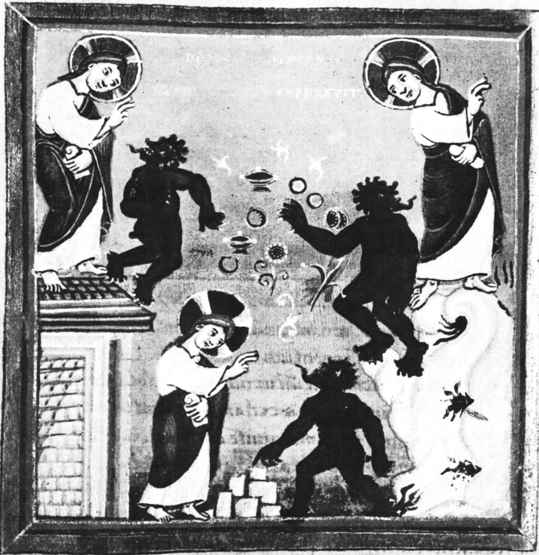
Abb. 3 Bremen, Univ.-Bibl., Ms. b. 21, Echternacher Evangelistar Heinrichs III., fol. 25v: Versuchungen Christi.

mos. & dep̄cabant̄ eū ut uel fimbriam uestimenti ei' tangerent. Et quotquot tangebant eum. salui fiebant. D O M̄. x L.