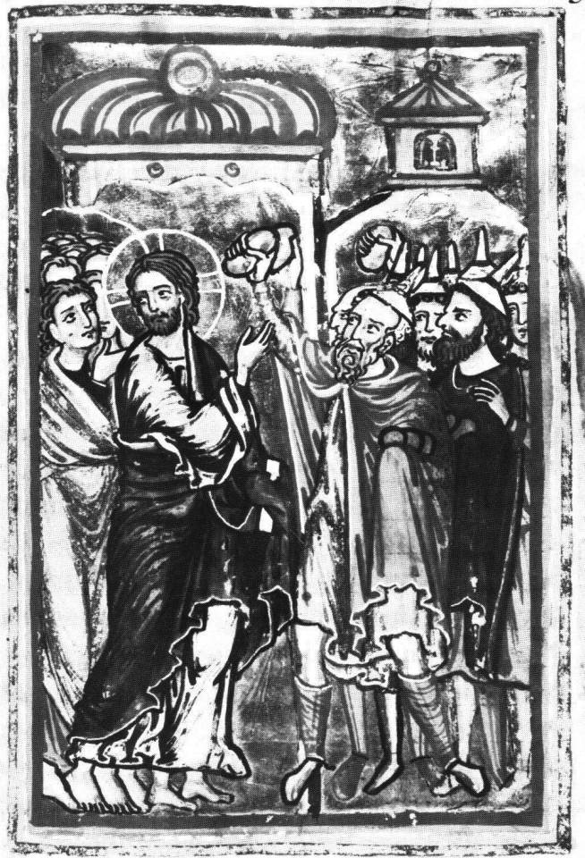
Abb. 5 Brüssel, Bibl. Royale, Ms. 9222, Evangelistar von Gross St. Martin Köln, fol. 58: Steinigung Christi.

Der Ratsmeister vereint die drei Versuchungen in einer realistischen Landschaft: Aus der Tempelzinne wurde der Balkon eines Turmes, dessen Bekrönung mit einer Zwiebelkuppel natürlich an den Felsendom erinnert, der in spätgotischer Zeit vielfach dem jüdischen Tempel seine Gestalt lieh. Und natürlich war es im spätgotischen Realismus nicht möglich, die Reichtümer der Welt, wie im Bremensis, gleichsam in der Luft schweben zu lassen. Man beachte auch die andersartige Gestaltung des Teufels.