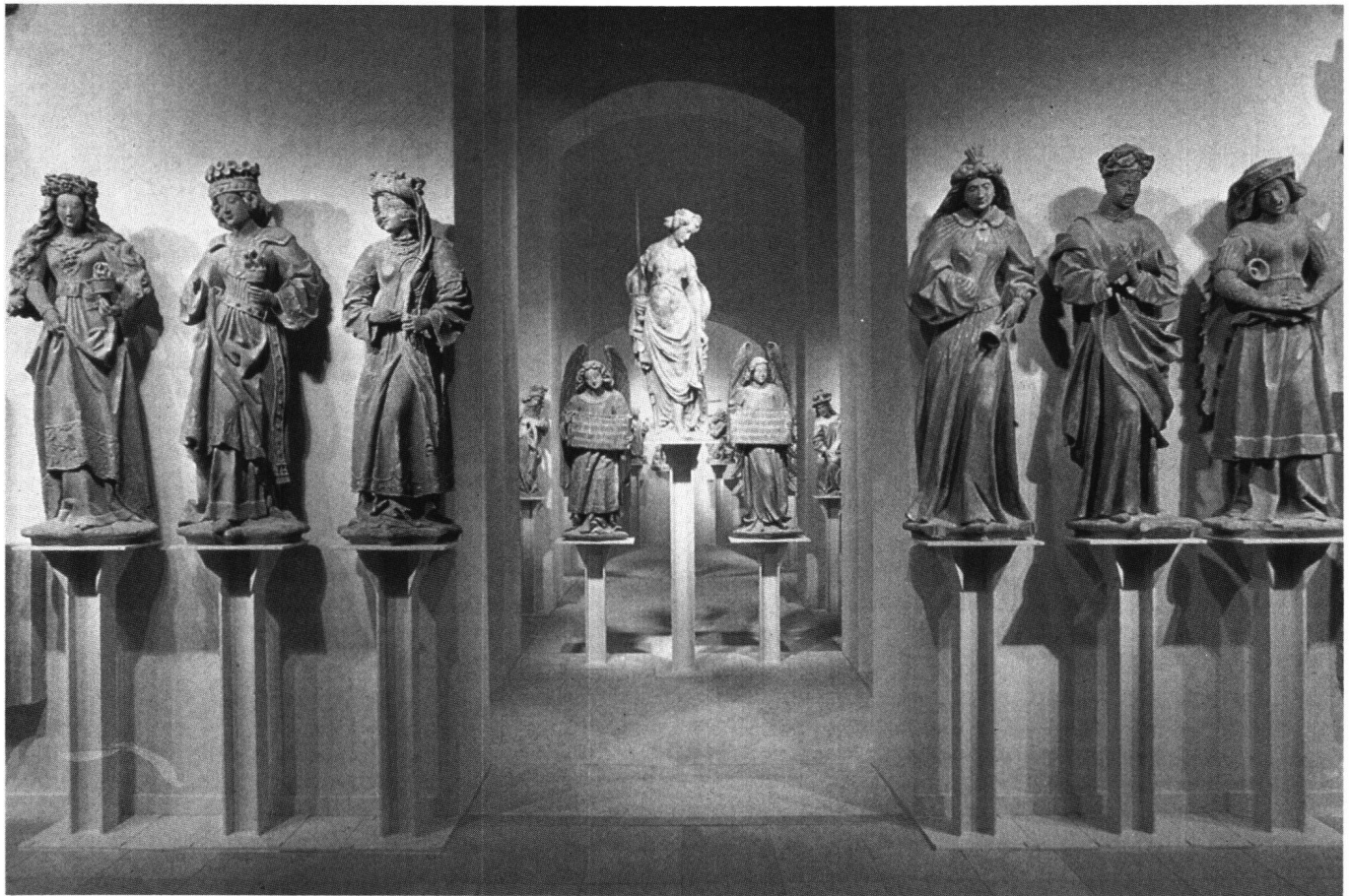
Abb. 2 Eingang zu den Münsterfiguren im Bernischen Historischen Museum, 1982.

dessen Wiederbemalung 1896 «aus Scheu vor lebensfrohen Farben» unterlassen worden sei. Das Verständnis für Farbe sei zu keiner Zeit so tief gesunken wie in den letzten fünfzig Jahren. Schon die alten Griechen und Römer hätten stets Farbe an Bauwerken und Skulpturen verwendet. Auch im Mittelalter sei die Farbe nicht wegzudenken: «Die Farben waren kräftig, in der Regel ungebrochen leuchtend, und erforderten grosses Können und tiefes Verständnis, um harmonische Wirkungen zu erzielen. Es blieb unserer Zeit vorbehalten, ein Mittel zu finden, Unkönnen und Verständnislosigkeit zu verdecken, indem sie alle Farben mit grau brach, ihnen die Leuchtkraft und das Leben nahm und alles in grauen Nebel verhüllte». 26 Das Beispiel der Wappentafeln habe gezeigt, dass anhand positiver Belege «die frühere Farbenpracht» wiederhergestellt werden konnte; man dürfe sich weder durch falsche Dogmen den Genuss vergällen lassen, noch dem gerade in Deutschland grassierenden Irrtum erliegen, «das Grosse gross zugrunde gehen zu lassen». 27