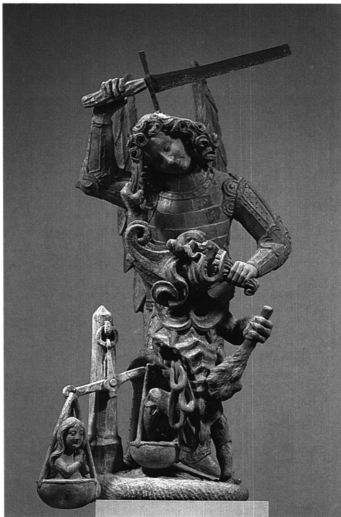
Abb. 3 Erzengel Michael, Zustand 1984.

Eine erste Untersuchung bestätigte die Voraussage ZEMP's, wonach die Polychromierung des Hauptportals nur partielle Fassungen zeige, deutlich erkennbar etwa an Gewandsäumen, Schmuckteilen oder Haartrachten. INDERMÜHLE seinerseits hatte behauptet, die Figuren seien ursprünglich ganz, wenn auch «diskret» bemalt gewesen. «Im Gegensatz zu den meisten noch erhaltenen mittelalterlichen Kirchenportalen, die ohne Ausnahme vollständig bemalt und meistens mit Gold gefasst waren, zeigen bei unserem Portal nur die Figuren farbigen Schmuck. Die Farbe ist sorgfältig überlegt verwendet und dient fast mehr zum Unterstreichen der besonders bildhauerischen Schmuckteile. Die ganze Art der Bemalung erinnert an diejenige der beginnenden Renaissance.