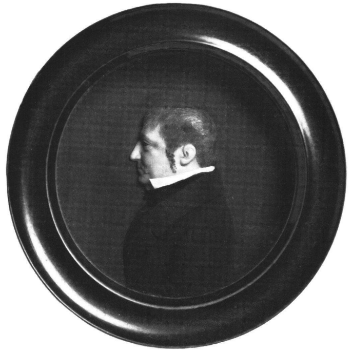
Abb. 16 Josef Gregor Heuberger: Bildnis eines Mannes aus der Familie Pfeninger. Schweizerisches Landesmuseum, Zürich.