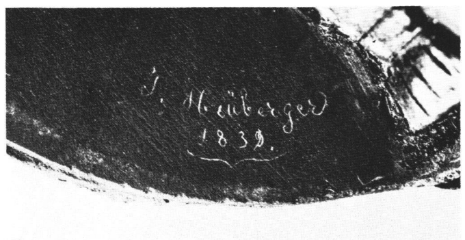
Abb. 22 Signatur von Josef Gregor Heuberger (Werkverzeichnis Nr. 60). Schweizerisches Landesmuseum, Zürich.