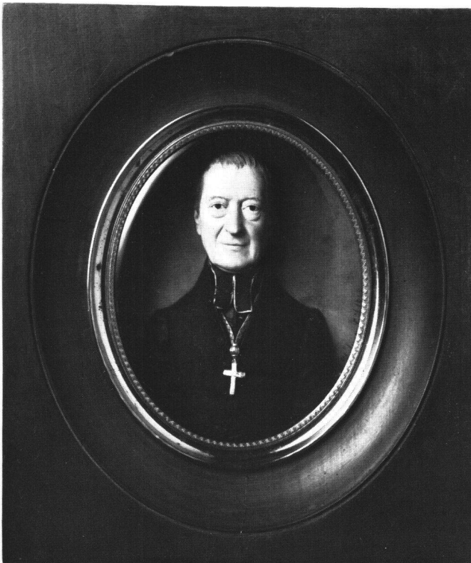
Abb. 4 Franz Xaver Heuberger: Bildnis von Friedrich Groß zu Trockau , Bischof von Würzburg , 1828. Schweizerisches Landesmuseum, Zürich.