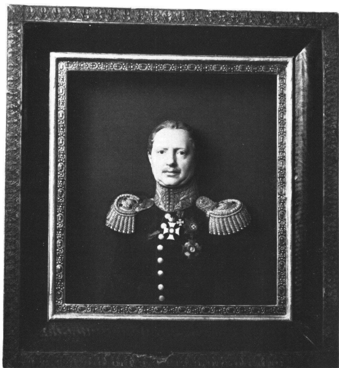
Abb. 7 Franz Xaver Heuberger: Bildnis von König Wilhelm I. von Württemberg , 1843. Schweizerisches Landesmuseum, Zürich.