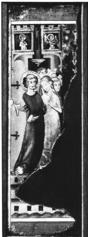
Abb. 1d Fragment eines Jüngsten Gerichts . Rückseite der nur teilweise erhaltenen Partie der sogenannten «Bieler Tafeln». Zürich-Konstanz, gegen 1330. Schweizerisches Landesmuseum Zürich (LM 7192.2). 85,5 × 28,5 cm.

malen Möglichkeit der Verbildlichung Gottes!) könnte dafür sprechen.