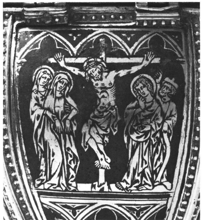
Abb. 2 Ziborium. Konstanz, frühes 14. Jahrhundert. Detail: Kreuzigung. Stiftsammlung Klosterneuburg. Höhe der Kreuzigung ca. 4 cm.

Vorerst soll sein Figurenstil analysiert werden, da damit die sichersten Hinweise für eine Lokalisierung gewonnen werden können 23 . Wie bereits angedeutet, wird der Pinsel von unserem Maler sowohl linear wie malerisch verwendet. Daraus resultiert zum Teil der zwiespältige Aspekt der Gemälde: Die Haare, Gesichtszüge und Hände sind betont graphisch behandelt; das Lineament spielt hier die für die Gestaltung wesentlichste Rolle. Im Gegensatz dazu sind die Gewandpartien in extrem breiten Pinselstrichen gemalt, wodurch ein plastischer Eindruck entsteht – an manchen Stellen wirken die Gewänder wie aufgebläht. Der robuste, kräftige Habitus der Figuren wird nicht so sehr durch ihren Körperbau, sondern vielmehr durch die Drapierung und die Modellierung ihrer Gewänder hervorgerufen. Teilweise schlaff herabfallend, teilweise prall wie gefüllte Schläuche, manchmal an Schulter- oder Kniepartien anliegend, umgeben die Gewandstoffe die amorphen Körper. Dieser Figurenstil zeugt – wenn auch nicht von besonderem Verständ-