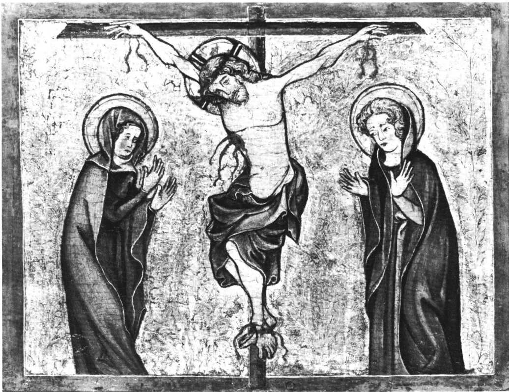
Abb. 6 Kreuzigung. Zürich-Konstanz, um 1325/30. Sammlung Heinz Kisters, Kreuzlingen. 17,8 × 23 cm.

müßten, nach dem Figurenstil zu urteilen, etwa gleichzeitig mit der Kreuzigung Kisters, vielleicht ein wenig vor ihr, gemalt worden sein. Die Art der Gewanddrapierung – relativ schwere Stoffe umhüllen locker und in reicher Fülle die Körper und gleiten in weich gewellten, breiten Bahnen zu Boden – läßt die Assistenzfiguren der Kreuzigung Kisters ähnlich voluminös wirken wie einige Figuren auf den Bieler Tafeln. Ist bei den Darstellungen auf dem Täfelchen des Zürcher Kunsthause noch nichts von einem Wechselspiel zwischen Körper und Gewand zu merken, so lassen Figuren auf den Bieler Tafeln – wie etwa unser Paradebeispiel, der Johannes auf Abb. 1a – bereits anklingen, was für die Kreuzigung Kisters ein deutliches Anliegen ist: die Dialektik zwischen dem Körperkern und dem teilweise von ihm abgelösten Gewand.