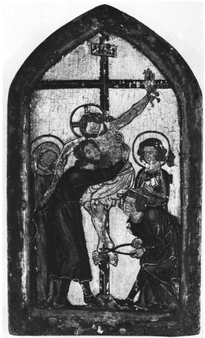
Abb. 5 Kreuzabnahme. Bodenseegebiet, um 1320. Kunsthaus Zürich. 18 × 10 cm.

Zwischen diese beiden kleinformatigen Gemälde fügen sich die Bieler Tafeln meines Erachtens recht gut ein. Sie