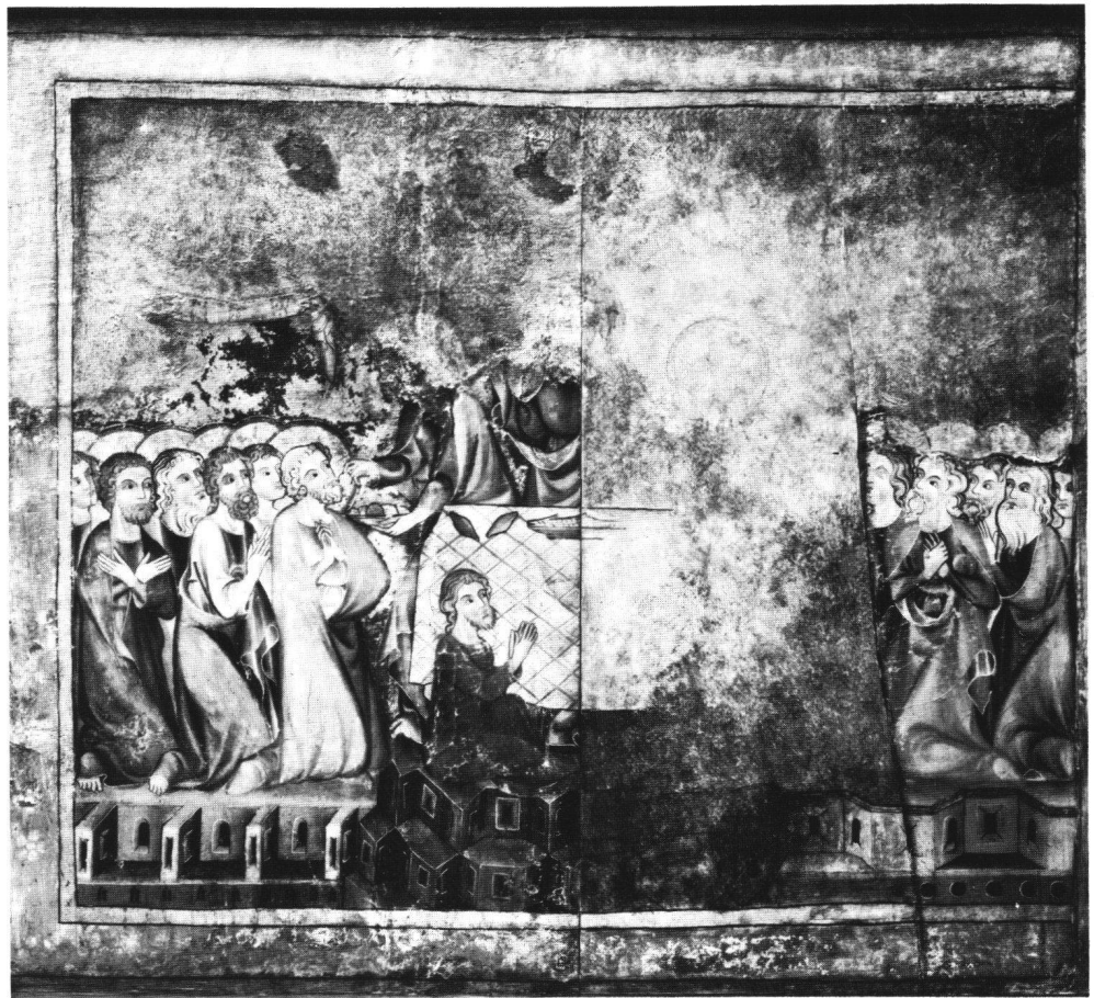
Abb. 1c Apostelkommunion . Rückseite des in der ganzen Größe erhaltenen Teils der sogenannten «Bieler Tafeln». Zürich-Konstanz, gegen 1330. Schweizerisches Landesmuseum Zürich (LM 7192.1). 85,5 × 99 cm.