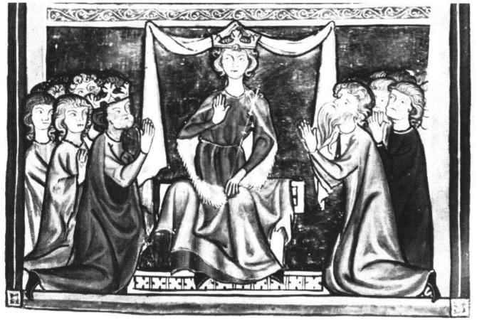
Abb.4 Weltchronik des Rudolf von Ems. Bodenseegebiet, Anfang 14. Jahrhundert. Fol. 195: Krönung von Davids Sohn. Stadtbibliothek Vadiana, St. Gallen, Cod. 302. 8,5 × 13,5 cm.

Das am meisten überraschende Ergebnis eines Vergleichs mit dem Katharinenthaler Graduale besteht jedoch darin, daß manche Gesichtstypen dort ebenso verwendet werden wie auf unseren Tafelbildern. Die allgemeine Vorstellung, die man in dieser Hinsicht vom Figurenstil des Bodenseeraumes im ersten Viertel des 14. Jahrhunderts hat und die man im Katharinenthaler Graduale paradigmatisch verkörpert sieht 27 , muß revidiert werden. Denn unter den zierlichen und formelhaft pointierten Physiognomien, die als «typisch bodenseesisch» gelten (als Beispiele dafür die Madonna auf Abb. 3a und die vornehme Dame auf Abb. 1b), finden sich auch des öfteren verhäßlicht-derbe Typen, wie wir sie ähnlich unter den Aposteln der Bieler Tafeln antreffen. So drückt sich zum Beispiel auf Fol. 190 v des Graduale in der Physiognomie zugleich das brutale Geschäft des Henkers aus (Abb. 3b), und selbst der – von seiner Rolle her nicht als abstoßend, sondern wohl eher als bäurisch-einfach aufzufassende – linke Hirte der Weihnachtsinitiale auf Fol. 18 v (Abb. 3a) hat Gesichtszüge, die sich deutlich von dem lieblich-