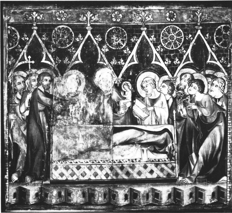
Abb. 1a Koimeis (Marientod). Vorderseite des in der ganzen Größe erhaltenen Teils der sogenannten «Bieler Tafeln». Zürich-Konstanz, gegen 1330. Schweizerisches Landesmuseum Zürich (LM 7192.1). 85,5 × 99 cm.

Abendmahls, eine Figur an der Stelle, die in der konventionellen Form des Gründonnerstagsbildes dem Apostel Judas, dem Verräter, vorbehalten ist. Möglicherweise handelt es sich auch in unserem Bild bei dieser Gestalt um Judas. In diesem Fall müßte der auf dem verlorenen Mittelstück zu ergänzende Apostel eine anachronistische Darstellung des heiligen Paulus (als Pendant zu Petrus auf der linken Seite) gewesen sein. Die andächtig-kontemplative Adorationshaltung der fraglichen Figur veranlaßt mich jedoch zu einer Hypothese: zur Deutung dieses einzeln vor dem Tisch des Letzten Abendmahls unterhalb der Gottheit kauern, unnimbierten Männleins als Abbild der Seele in der mystischen Beschauung Gottes 8 . Eine derartige Interpretation wäre zwar innerhalb eines konventionellen Abendmahlsbildes mehr als befremdlich, paßt aber ganz gut zu der speziellen ikonographischen Variante auf unserer Tafel. Denn hier wird – wie man an der verdreifachten Gottesfigur leicht erkennen kann – nicht einfach der historische Vorgang aus der Passion Christi abgebildet, sondern dessen heilsgeschichtliche Wirkung bildlich ausgelegt; möglicherweise geht diese Auslegung sogar über eine Anspielung auf das Sakrament der Eucharistie hinaus und schließt eschatologische Gedanken mit ein – die Darstellung der Trinität (der maxi-