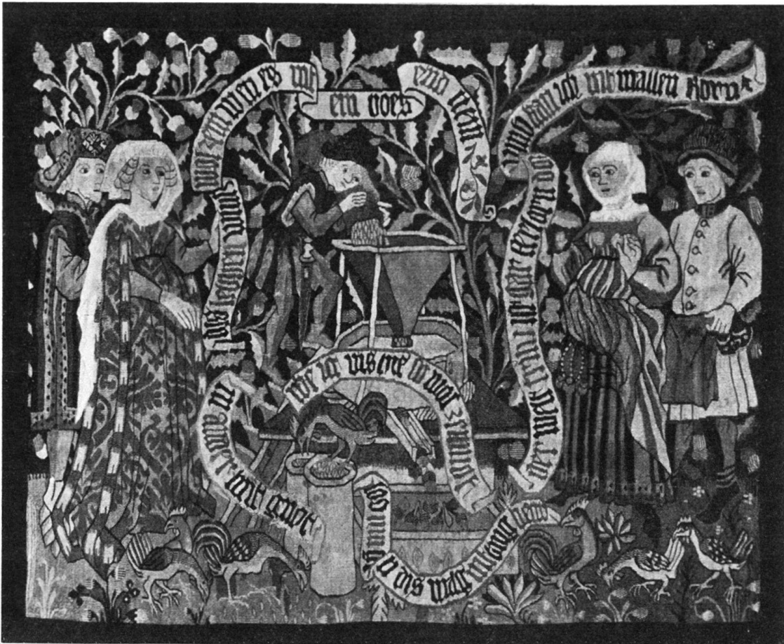
Abb. 1. London, Sammlung Sir William Burrell Bildteppich mit dem unredlichen Müller

bewachsenen, von kleinen Tieren belebten Bodengrund zu vergleichen. Wie dort das Weinspalier bilden hier lebhaft geschwungene Eichenranken den tapetenartigen Abschluß. Die Musterkarte der Farbtöne stimmt ebenso überein wie Material und Technik. Auch finden Form und modische Differenzierung der Gewänder vielfältige Analogien. So kehrt das streifenförmig schattierte Kleid der Bäuerin mit den die Brüste markierenden weißen Kreisen, dem Röhrenfaltenrock und dem aufgeschlagenen Obergewand bei der zweiten Dame des Liebesteppichs wieder. Während das pelzbesetzte reichgemusterte Kostüm der Dame auf dem Müller-Teppich in der Zeittracht der schachspielenden Königin ihr modisches Gegenstück erkennen läßt 4) (Abb. 2).