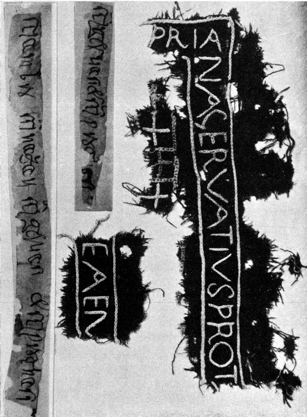
Abb. 2. Gestickte Inschrift und zwei geschriebene Authentiken. S. Maurice (Wallis).