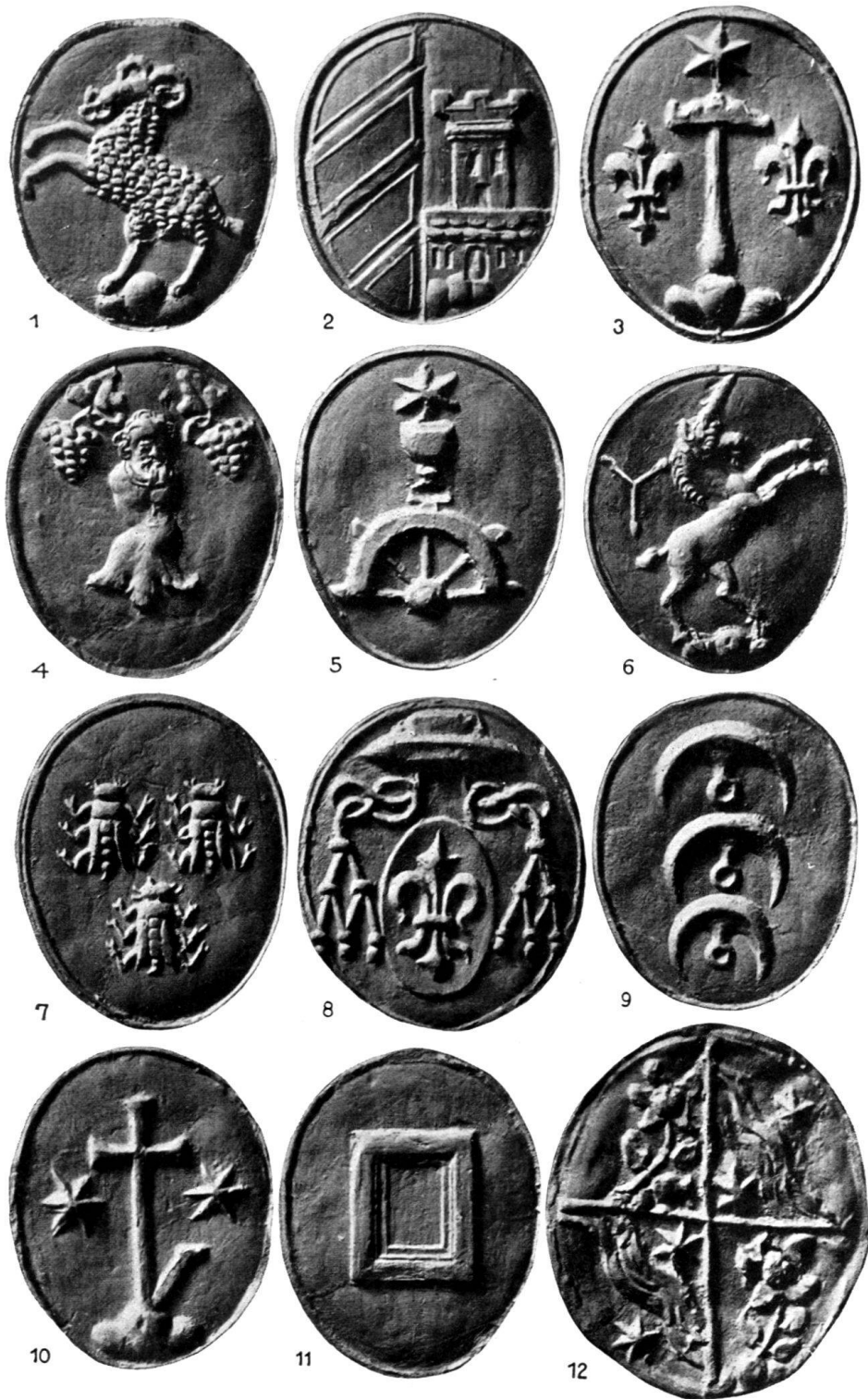
Wappen der Zuzacher Freitagsglocke von 1639.