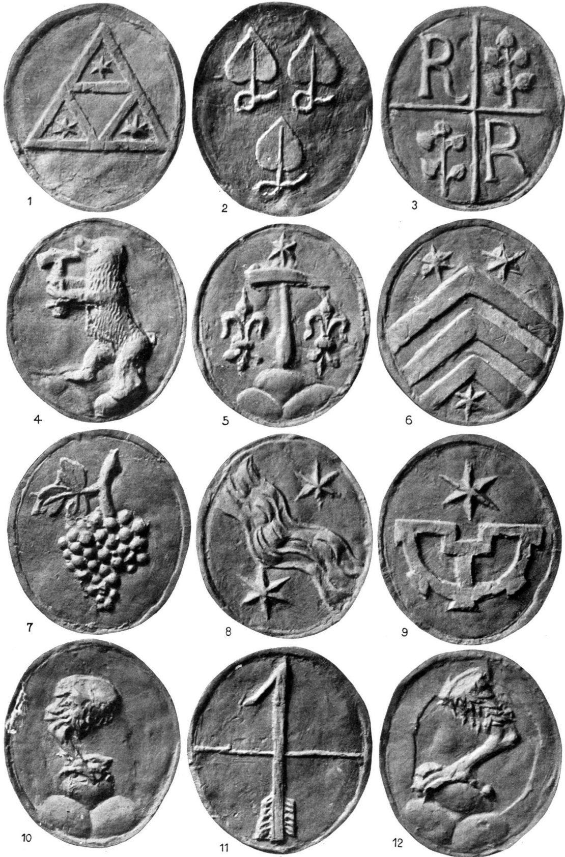
Wappen der Zurcher Verenaglocke von 1669.