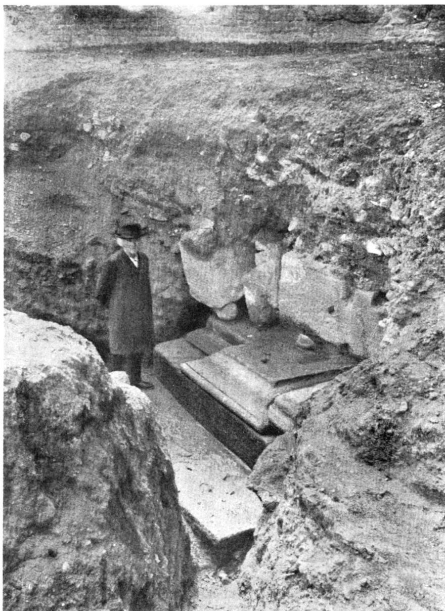
Grès coquillier de la Molière dans les fouilles d'Avenches.