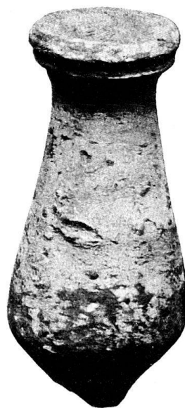
Abb. 10. Krüglein aus der Grabung Rauber, Küfer. (Aufnahme von Edm. Fröhlich).

Der Schuppen zwischen der soeben genannten Wirtschaft Schatzmann und der Post enthält einen Keller, in dem eine römische Mauer zu Tage