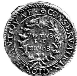
Fig. 64. Nr. 735.