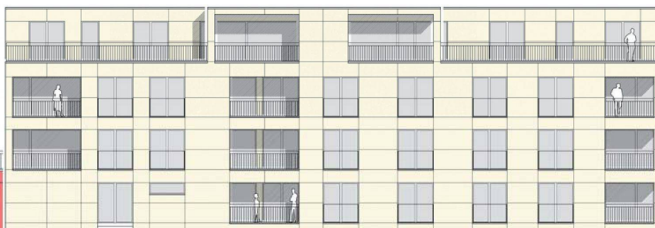
Bei ihrem jüngsten Projekt, das im Herbst 2010 in Näfels bezugsbereit wird, baut die Genossenschaft erstmals auf erworbenem Land. Sie wird hier 14 grosszügige Alterswohnungen zur Verfügung stellen. Die Illustrationen zeigen die Westfassade sowie einen Wohnungsgrundriss, der gegen Westen ausgerichtet ist.

Die private Finanzierung stellte schon beim ersten Projekt eine überwindbare Hürde dar. Und neben den vielen Privatpersonen, die Anteilscheine zeichneten, konnten Zuschüsse aus der kantonalen Wohnbauförderung sowie ein Darlehen aus dem Fonds de Roulement entgegengenommen werden. Die Gemeinde Näfels half bei Grund und Boden aus. Eine für öffentliche Bauten vorgesehene Parzelle wurde im Baurecht an die Genossenschaft Alterswohnungen zu üblichen Konditionen abgetreten.