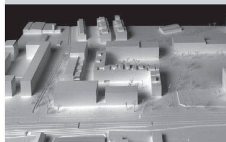
Müller Sigrist (2. Rang) setzten auf mäandrierende Zeilen, die zwei Aussenraumtypen bilden.