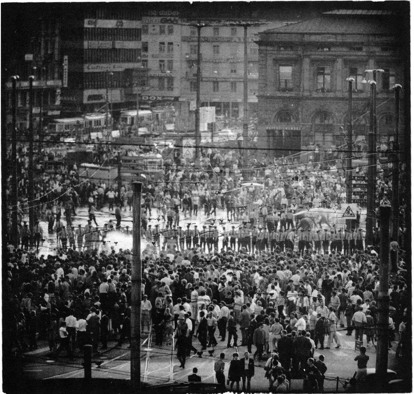
28./29. Juni 68, Bahnhofplatz Zürich: 'Globuskrawalle'