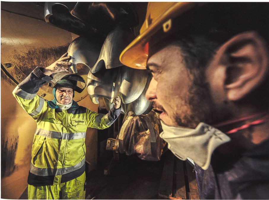
Für Erfahrung gibt es keine Abkürzung: Repower kann auf eine über 100-jährige Tätigkeit zurückblicken.

das nationale Höchstspannungsnetz angebunden sowie das regionale Verteilnetz unter anderem über den Netzknotenpunkt Avegno versorgt.