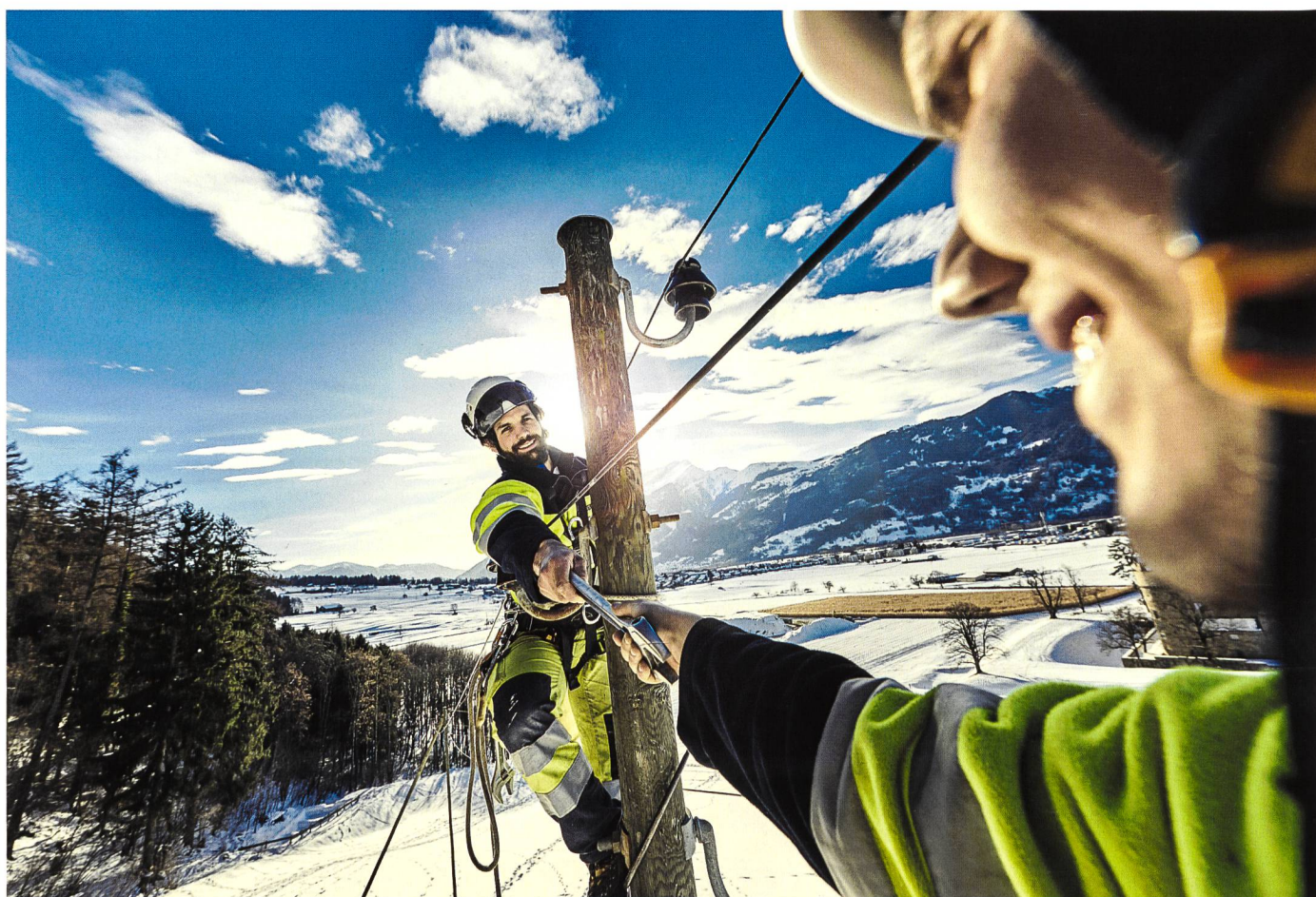
Hand in Hand: Repower hält Ihre Anlagen mit Wartungsarbeiten in Schuss.

Im Auftrag von Swissgrid durfte Repower als Generalplanerin das neue 220-kV-Unterwerk in Avegno planen, die Ausführung begleiten und im letzten Jahr auch die Inbetriebsetzung leiten. Im Schweizer Übertragungsnetz ist das Unterwerk Avegno eine wichtige Schaltanlage. Sie erhöht die Versorgungssicherheit im regionalen Verteilnetz wesentlich. Ausserdem wird in Avegno das Wasserkraftwerk Verbano an