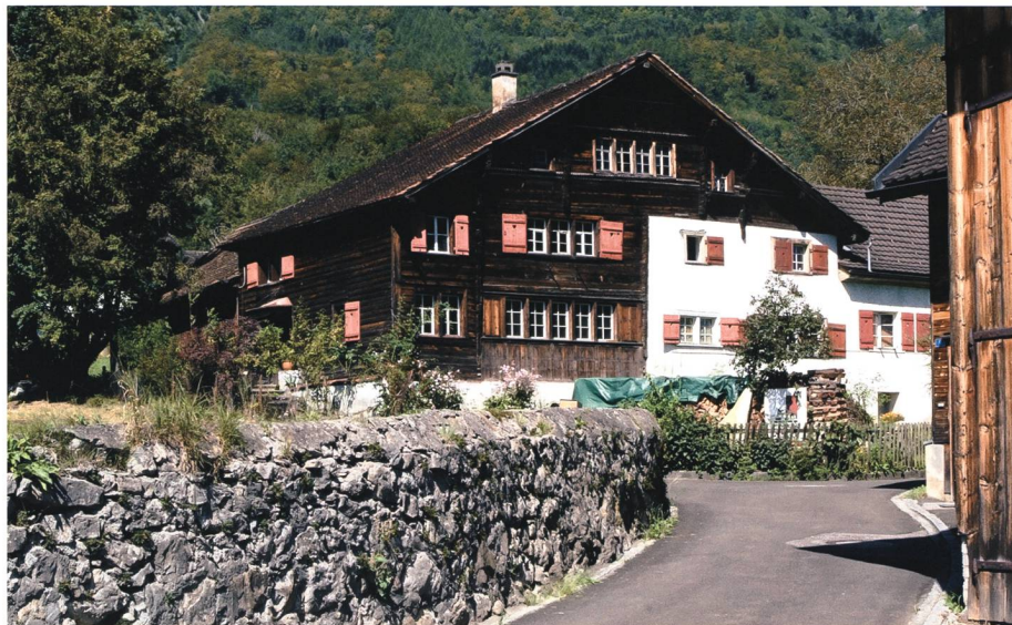
Jahrhundertealte Strickbautradition, hier in Sennwald, Läu 7.

Objekte verschafft. Dazu gehören neben kunsthistorisch interessanten Gebäuden samt ihrer Ausstattung auch Brunnen, Bildwerke sowie historisch interessante Verkehrs- und Militäreinrichtungen. Der Zeithorizont der