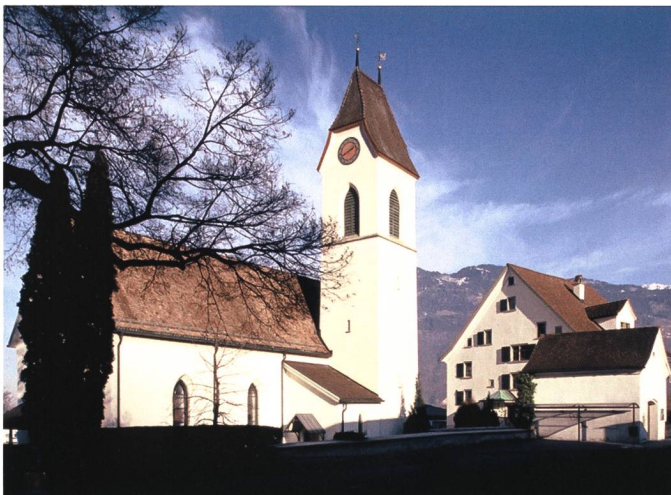
Kirchenbezirk Sevelen mit Beinhaus und Pfarrhaus.