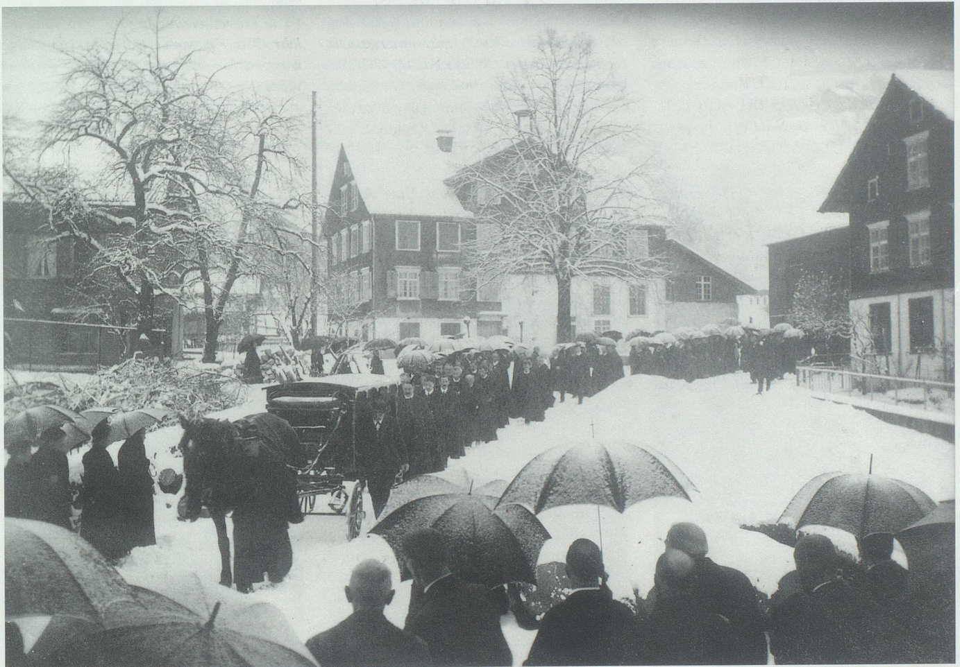
Leichenzug um 1930 beim ehemaligen Restaurant Glocke in Grabs.