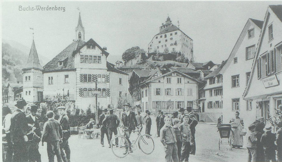
Das Zentrum Werdenberg als Marktplatz und Treffpunkt im Jahre 1915.