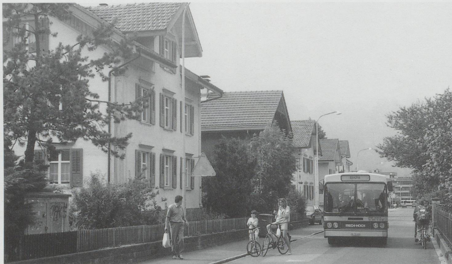
Schulhausstrasse in Buchs 1996: Heute haben die Eltern um ihre Kinder auf dem Schulweg vielfach Angst. Sobald aber der motorisierte Verkehr geringer und weniger schnell ist, findet auf der Strasse immer noch (oder wieder) Kommunikation statt.