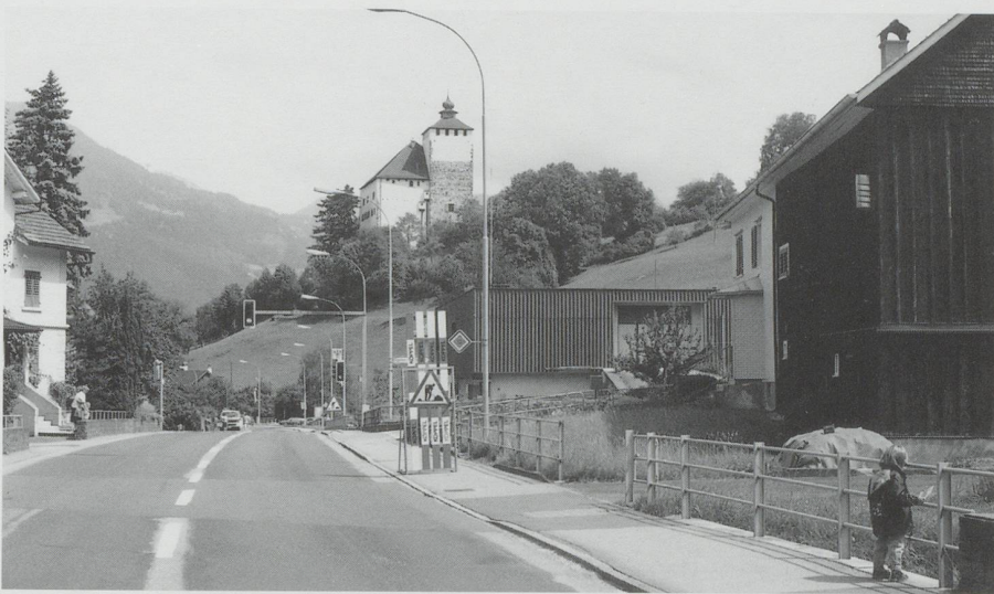
Bei der Brücke über den Lognerbach in Werdenberg 1996: Der Erlebniswert für Fussgänger ist stark eingeschränkt. Die Beleuchtung ist ebenso fussgängerunfreundlich wie die Baustellentafel, die als Information für die Autofahrer mitten auf das Trottoir gestellt wurde.

Vor dem Bezirksgebäude Buchs 1935: Bereits sind mit dem Trottoir erste Anzeichen einer Verkehrstrennung sichtbar. Die Leute fühlen sich aber auf der Strassenmitte offenbar immer noch wohl und sicher.