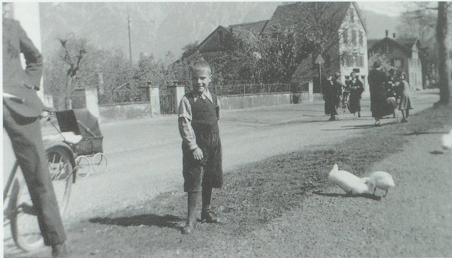
St.Gallerstrasse am Werdenbergersee 1940: Noch ist die Strasse ein Teil des Flanierweges.