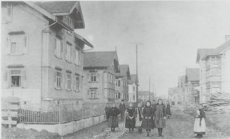
Schulhausstrasse in Buchs um 1904: Damals konnten die Kinder für den Fotografen noch auf der Strasse posieren.