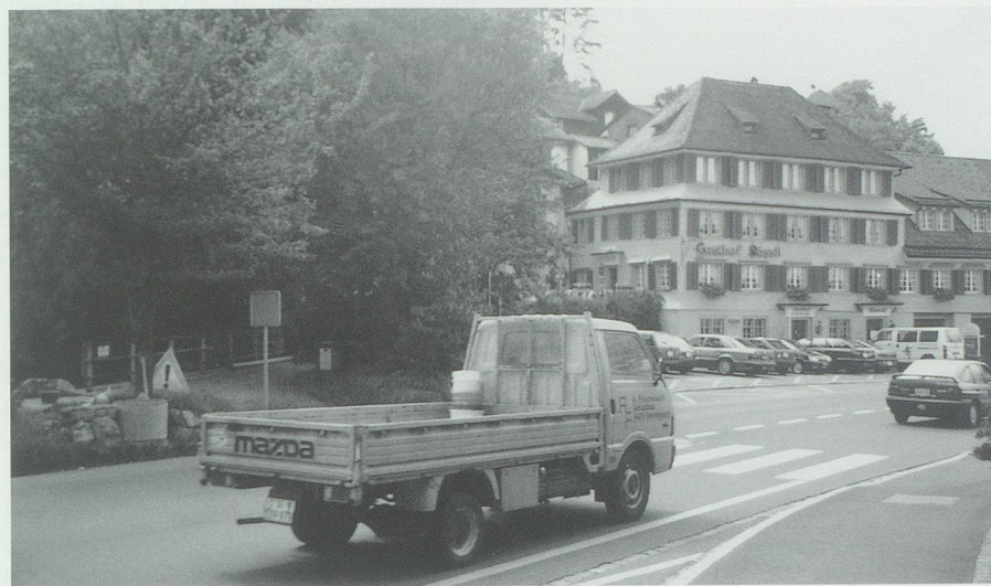
Das Zentrum Werdenberg 1996: Die Fläche wird grösstenteils vom motorisierten Verkehr beansprucht. Historisch wertvolle Gebäude können, da von parkierten Autos verstellt, ihre Wirkung auf die Passanten nur mehr beschränkt entfalten.

St.Gallerstrasse in Buchs Richtung Werdenberg um 1910: Strassenräume sind die öffentlichen Räume schlechthin. Sie dienten früher allen Nutzungen gleichermassen, die Leute hielten sich in ihrer Mitte auf.