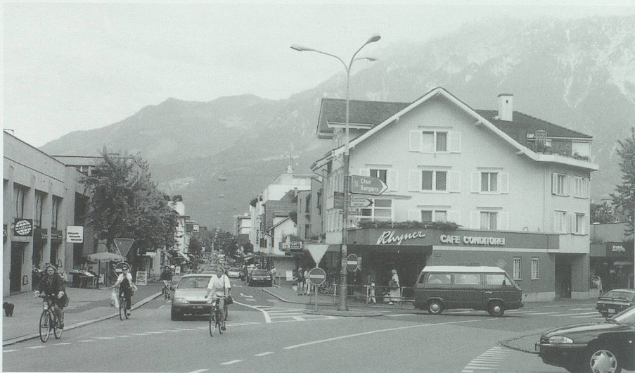
Ochsenkreuzung in Buchs 1996: Die Fläche dient als Verkehrsknoten: Verkehrsteiler, Strassenmarkierung, Strassenkandelaber und Reklameschilder beeinflussen das Strassenbild. Den Fussgängern werden erhebliche Umwege zu den Fussgängerstreifen zugemutet.

das Trottoir zu benützen. Das 1958 beschlossene und heute (mit nachträglichen Änderungen) gültige Strassenverkehrsgesetz hält es nicht anders. Es schreibt in Art. 49 vor: «Fussgänger müssen die Trottoirs benützen. Wo solche fehlen, haben