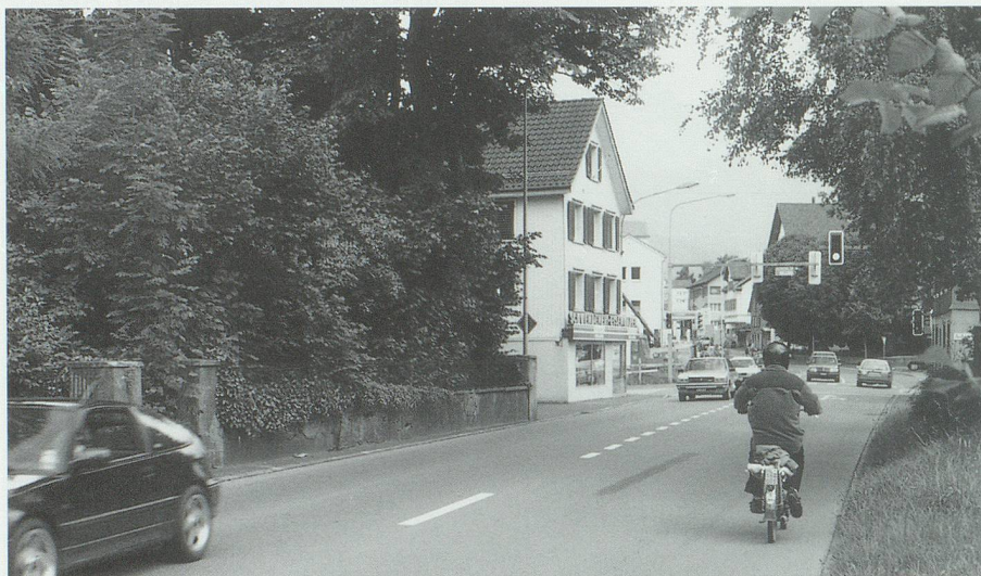
St.Gallerstrasse am Werdenbergersee 1996: Der Werdenbergersee ist nach wie vor ein attraktives Naherholungsziel, das Spazieren wird aber durch Lärm und Gestank von der angrenzenden Staatsstrasse beeinträchtigt.

Gebäude auf die Strasse orientiert. Zum Teil durch die Lärmschutzverordnung gefördert, kam es zum Bestreben, die Gebäude vom Strassenraum abzuwenden oder die Gebäude mit Wänden von den Immissionen des motorisierten Verkehrs abzuschirmen. Die Konsequenz ist, dass viele Strassenräume noch öder und unwirtlicher werden. Kommt dazu, dass sich das Leben der Gebäude nicht mehr gegen den öffentlichen Raum, sondern rückwärtig abspielt. Die Vorteile einer solchen Lösung sind unbestritten, aber der eigentliche Strassenraum verarmt dadurch.