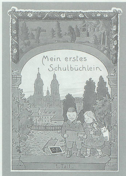
«Mein erstes Schulbüchlein 1. Teil», das Sommerbüchlein, und sein Gegenstück, das Winterbüchlein, Titelblätter.

Daneben bot die Natur selber reiches Anschauungsmaterial; auf Schulreisen und Spaziergängen in der näheren Umgebung konnten Tiere und Pflanzen beobachtet werden. Die alljährlich stattfindenden Schulreisen boten willkommene Abwechslung; keine grossen Ausfahrten, vielleicht nach Malbun im Liechtenstein oder zur Burg Wartau, ein Weg zu Fuss, die Rückfahrt per Postauto. Bewährte Reiseziele wiederholten die einen Lehrer stets Jahr für Jahr, andere bevorzugten Abwechslung. Im Sommerhalbjahr war der Unterrichtsbeginn um halb acht, während des Winters erst um acht oder gar halb neun Uhr. Noch bis 1970 folgte die Einteilung der Ferien oder Freitage ganz den Bedürfnissen des bäuerlichen Jahreslaufes: Heuerferien und Heutage im Frühsommer, kurze Sommerferien, damit die Kinder bei der Ernte mithelfen konnten, Dreivierteljahres-Schule. Doktor Widmer, der damalige Schularzt, setzte sich beim Schulrat für den schulfreien Mittwochnachmittag ein; ihm verdanken die Grabser Schüler auch die