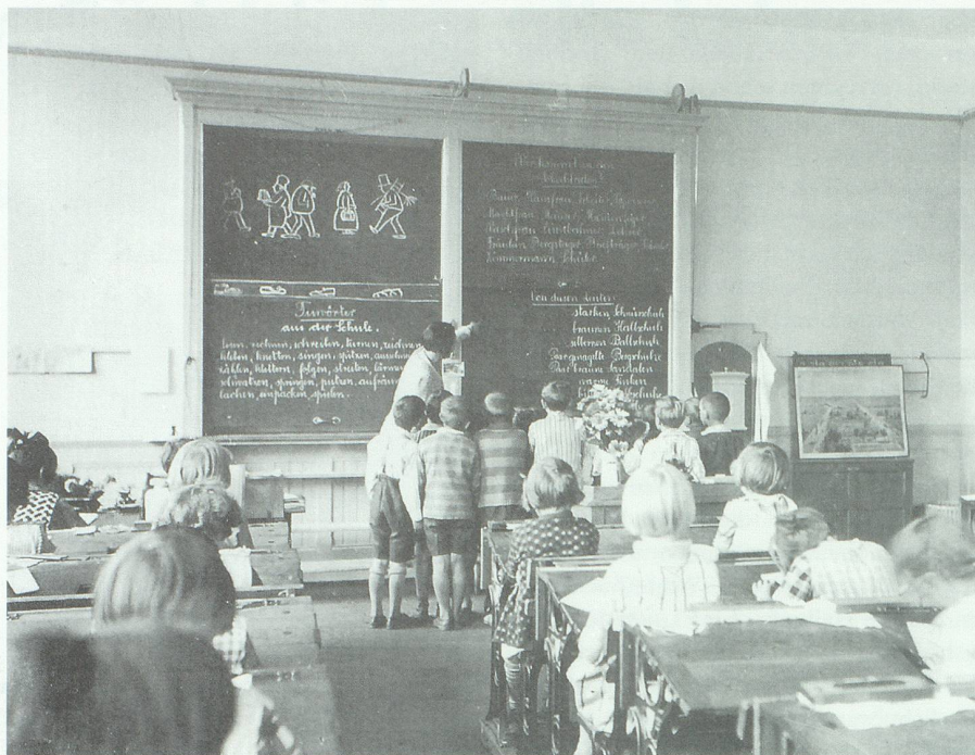
Blick in eine Schulstube aus den dreissiger Jahren: Enge Bänke, viele Kinder. Klassen von 40–50 Schülern waren keine Seltenheit. Der Unterricht verlangte deshalb besondere Disziplin: Stillsitzen, aufpassen...!

Nicht überall stiessen seine auch für uns Heutigen modernen Ideen auf Zustimmung, und in manchen Augenblicken musste er sich als einsamer Vorkämpfer gefühlt haben. Er war es, der damals als erster für die Knaben den Handwerksunterricht einführte, der mit den Schülern ganzheitlichen Unterricht betrieb und im Sinne Pestalozzis «Herz, Kopf und Hand» der Schüler ansprechen wollte. Besonders bei den Theateraufführungen konnten alle