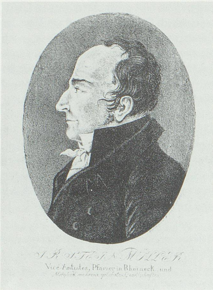
Johann Rudolf Steinmüller. Porträt aus W. Vogler, «Werdenberg um 1800». Buchs 1987.

und Metzen, und ihre Hauptnahrung verschaffen ihnen Erdapfel und Türkischkorn, die jeder unentgeltlich auf seinen Neugütern und Gärten im Ueberflusse anpflanzen kann. Ein Werdenberger Wirth sagte mir letzthin: 'haben wir genug Erdapfel und Türken in unsern Haushaltungen, so sind wir ausgemachte Herren!' – Treffen zu diesem noch Gerathjahre in Ansehung der Baumfrüchte ein, so bedient man sich zugleich des dürren und grünen Obstes und des Obstweins. – Jeder Bauer backt sein Brodt selbst; in Warthau und Sevelen besteht dasselbe aus Roggen- Türken- und Heidenkorn, bisweilen mischt man auch noch ein wenig Weizen darunter; in den übrigen Gemeinden, wo wenig Roggen und Weizen und gar kein Heidekorn gepflanzt wird, besteht dasselbe meistens aus Türkischkornmehl. Vermögliche Bauern und Wirthe backen jedesmahl, neben dem gewöhnlichen Hausbrodt, noch ein wenig Weizenbrodt, und vermischen den Teig bisweilen mit fein verschnittenen dürren Birnen. 7 – Aus dem Türkenmehl wird auch häufig eine Art Brey zubereitet. Von den sogenannten Heimschkühen erhält man des Sommers die Milch für die Haushaltungen, und von dem Vieh auf den Alpen, die das Jahr hindurch nöthigen Käse und Butter. – Neben dem ist das Land gar nicht stark bevölkert, und nach Verhältniß der unübersehbar großen Strecken wage-rechter Allmenten, woran alle Gemeindsgenossen Antheil haben, könnte dasselbe eine zweyfach grössere Volksmenge er-