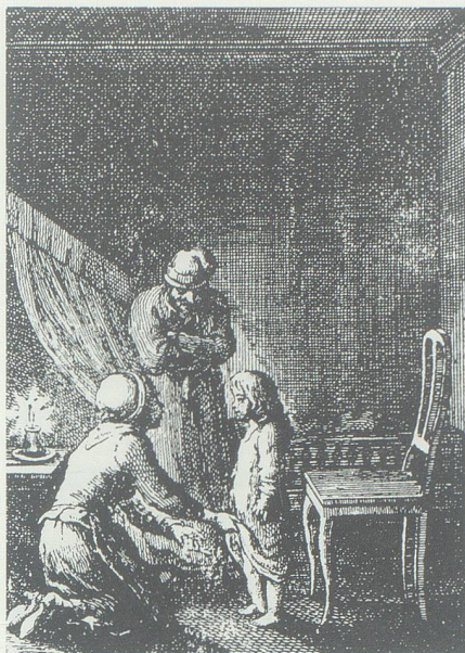
Das von Anna Göldi angeblich verhexte Mädchen. Bild aus dem Jahre 1783 in Aebi 1983.

Zum drittenmal nun fuhr er in dieser langweiligen Angelegenheit hin und her; nicht zum Vergnügen, denn er hatte sich umsonst auf die Jagd ennet dem Rhein gefreut. Dafür liess er noch mehr als sonst