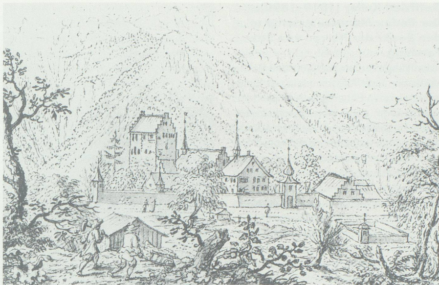
Schloss Forstegg um 1750, nach Uhlinger.

Darum erjagt er auf der Flucht Den Führer in der Öde, Steh! schreit er, und der Hiebe Wucht Begleiten seine Rede; Da hiess es ehrlich: nimm und gieb, Nach manchem Wechselstoß und Hieb Zu Boden fielen Beede.