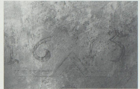
Freigelegte Jahrzahl 1615 im Chorscheitel.

polychromer Fassungen. Diese Tatsache bewog den Kirchenverwaltungsrat, die empfohlenen Freilegungs- und Restaurierungsarbeiten in Auftrag zu geben, obwohl diese ursprünglich nicht geplant waren.