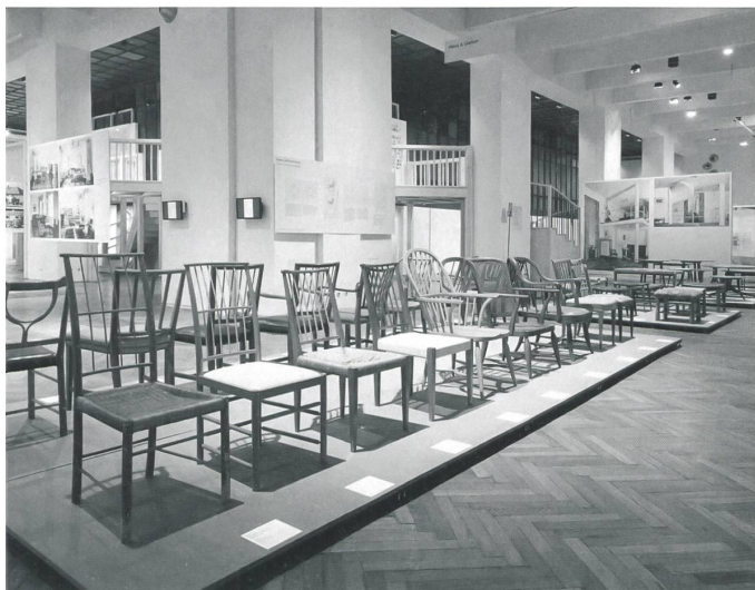
Den Hintergrund der Schau mit Originalmöbeln und Stoffen bildet eine Holzgalerie, erschlossen von drei Treppen: 1:1-Modelle von Franks Entwürfen und gedankliche Essenz zur Erschließung als Wahrnehmungsapparat des Wohnens.