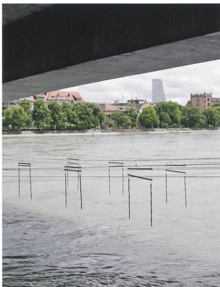
Im Schatten der Dreirosenbrücke. Die Stadtansichten des Fotografen Beat Aemmer führen durch dieses Heft.

Thomas Aemmer (1982) lebt in Interlaken. Er hat den Lehrgang Fotodesign an der Berufsschule für Gestaltung in Zürich absolviert. Seit 5 Jahren arbeitet er schweizweit als selbstständiger Fotograf mit Fokus auf Dokumentar-, Interior- und Architektur-Fotografie. Dabei stehen stets der Bezug zum Menschen oder dessen Wirken im Mittelpunkt. Alle seine Fotos vereint ein subtiler Hang zur Ironie. Uns hat besonders seine Bildstrecke «Künstliche Natürlichkeit» ( thomasemmer.allyou.net ) überzeugt, ihn mit dem Streifzug durch Basel zu beauftragen.