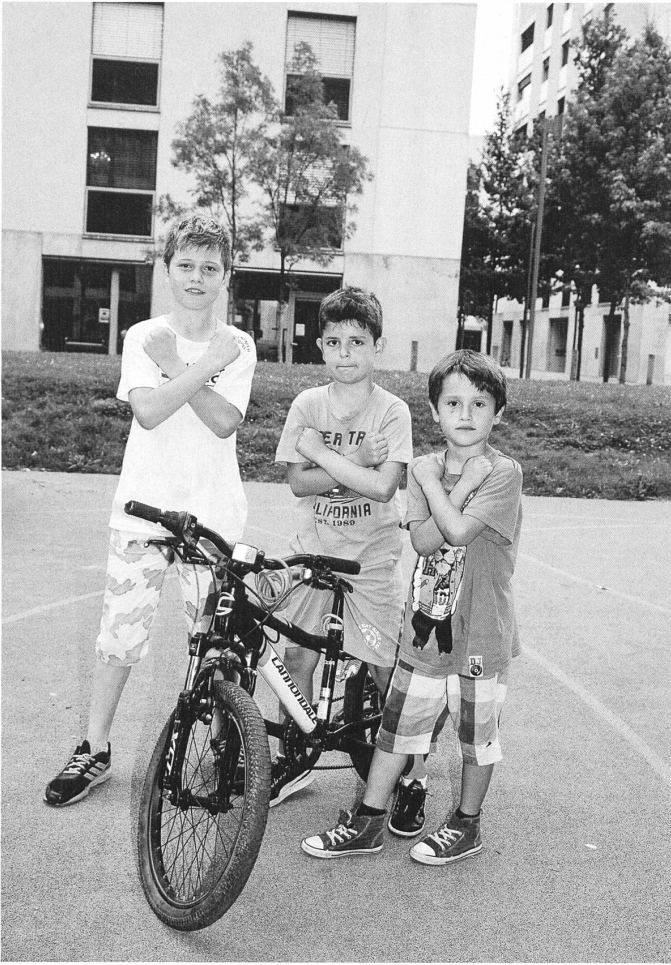
Boyz in the hood: Kinder in der Siedlung Werdwies in Zürich-Altstetten. Bild: Claudia Klein aus dem besprochenen Band.