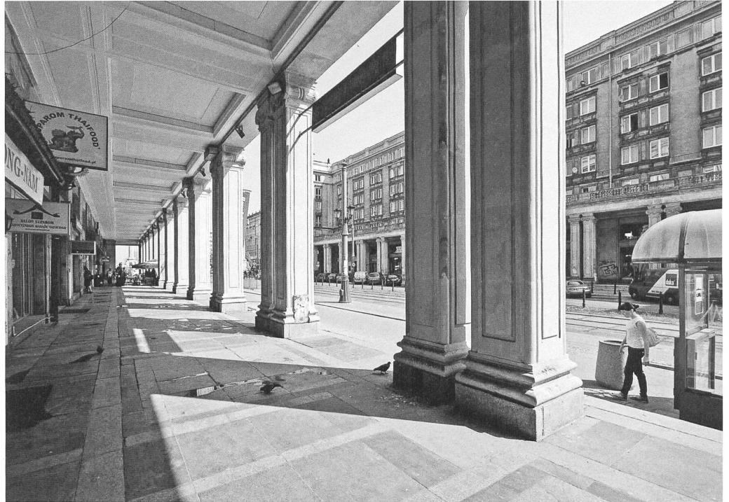
Marszałkowska-Wohnviertel MDM: Südlich des Konstytucji-Platzes (Platz der Verfassung) begleiten Kolonnaden die Marszałkowska-Strasse. Hier blieb die Strassenbreite der Vorkriegszeit erhalten.

Eine Reise im Rahmen eines Entwurfsemesters an der Zürcher Hochschule für Angewandte Wissenschaften ZHAW führte den Zürcher Architekten und Dozenten Thomas Schregenberger nach Warschau. In der polnischen Hauptstadt entdeckte er für sich eine Architektur, die über die Fassadengestaltung eng und subtil mit dem Stadtraum verzahnt ist. Das «Freiluftmuseum der jüngeren europäischen Städtebaugeschichte» erlaube den Vergleich des im Westen wenig beachteten Städtebau des Sozialistischen Realismus mit dem Siedlungsbau in der Zeit davor und danach.