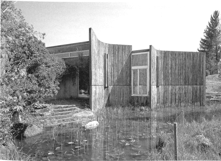
Das 1969 erbaute EFH Neuenschwander «in Binzen» ist Teil der Künstlersiedlung Gockhausen, die in langjähriger Entwicklung entstanden ist. Die enge Verbindung von Wohnbereich und Natur und der skulpturale Ansatz seiner Architektur kommen in diesem Haus zum Tragen.