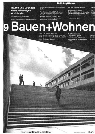
Bauen+Wohnen, Covergestaltung 1960