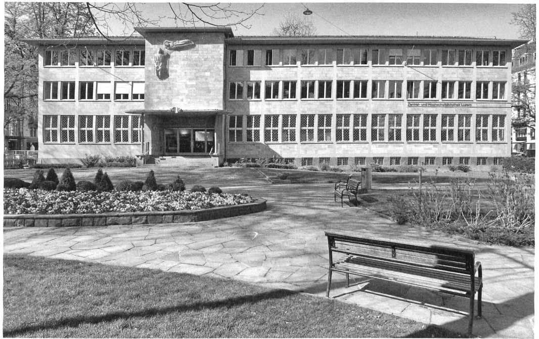
Die 1951 erbaute Zentralbibliothek und der Quartierpark Vögeligärtli im dicht bewohnten Luzerner Hirschmattquartier.

Das Verfahren ist unnötig: Ein Projekt für die Instandsetzung der ZHB wurde 2010 in einem offenen Projektwettbewerb ermittelt; der Baukredit von 18,8 Mio. CHF wurde vom Kantonsparlament gesprochen, später