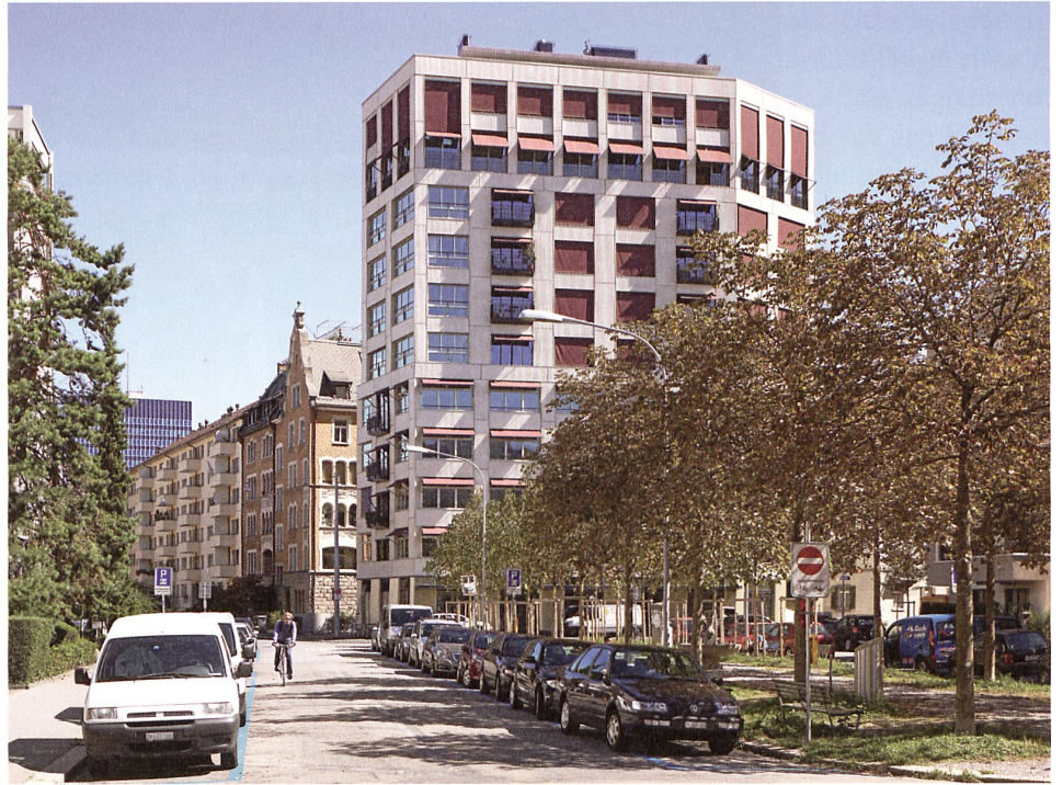
Das Wohnhochhaus reiht sich in die Gründerzeitstadt ein und bezieht sich auf eine vor bald hundert Jahren angelegte kleine Parkanlage an der Weststrasse.