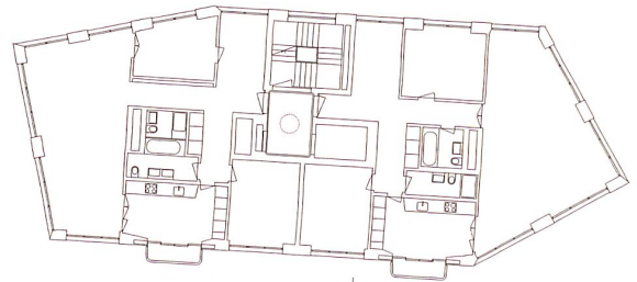
5. bis 8. Obergeschoss