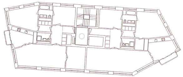
1. bis 4. Obergeschoss