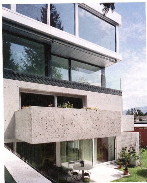
Lukas Lenherr stapelt fünf Häuser zu einer Mittelland-Collage.