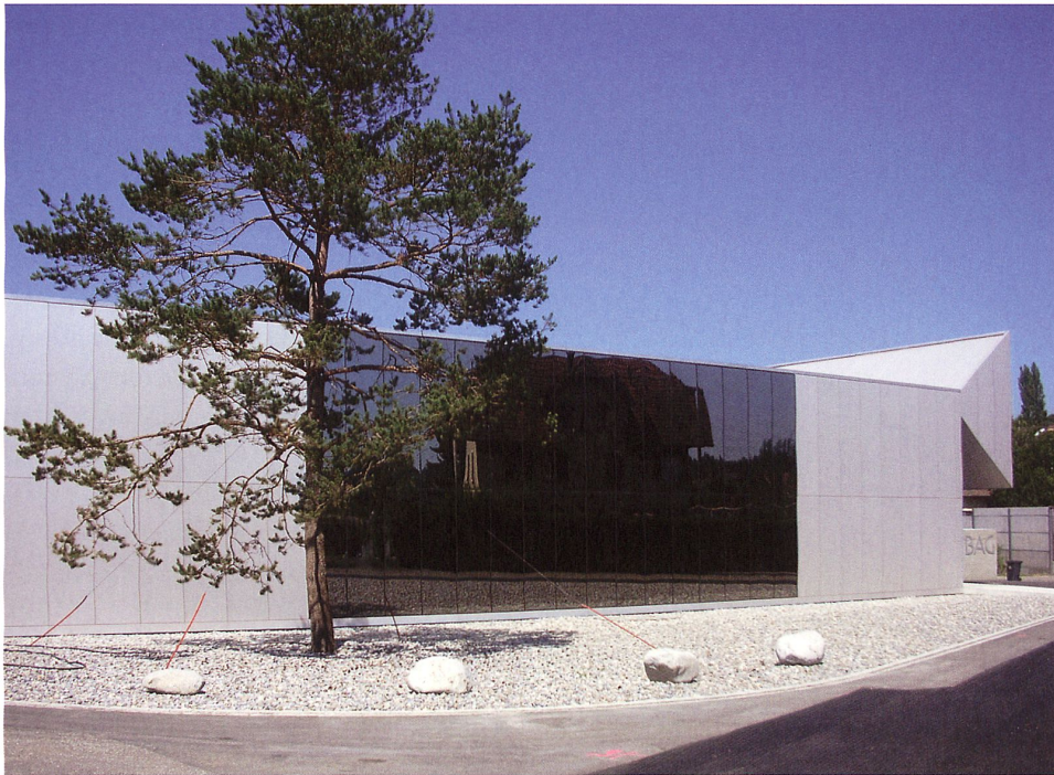
Am «Ufer» der Autobahn: Seitenansicht des Gebäudes, die dreieckige Konstruktion weist in voller Länge auf die Strasse.