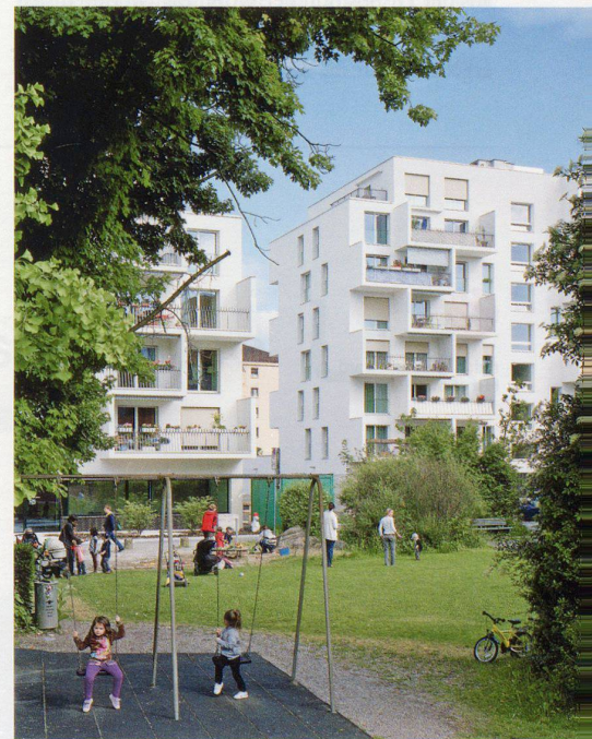
Drei gestaffelte Baukörper auf einem Gemeinschaftssockel (oben); Vorraum für vier Wohnungen (unten)

Mit der Entscheidung, die Wohnungen als Vierspanner in drei Volumen mit je eigenem Eingangsbereich anzuordnen, fanden die Architekten die Zustimmung der Wettbewerbsjury, die die