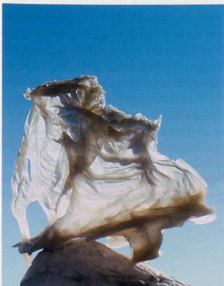
Wachsstudien zur Formfindung, 1980er Jahre, Merete Mattern