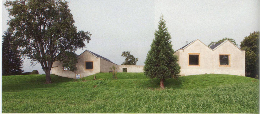
Die beiden zusammenhängenden Häuser, Strassen- und Gartenansicht