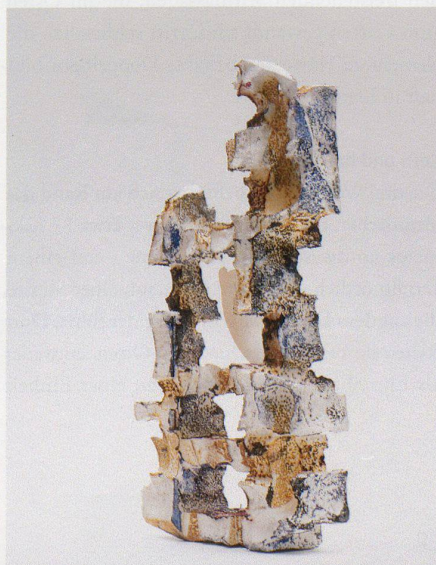
Raumspiele in Styropor, 1967–73, Franz Krause