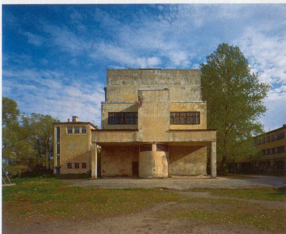
Grigori Simonow, Abschluss der Sporthalle der Schule, 1927–29, Uliza Tkatschej 9, St. Petersburg, Zustand 1999