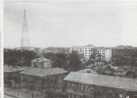
Bilder: © Museum für Architektur Schtschusew, Moskau

Unbekannter Fotograf, Architekt K. S. Melnikow und seine Frau vor dem Rohbau des Melnikow-Hauses, 1920er Jahre (oben); Unbekannter Fotograf, Blick auf Moskau im Gebiet der Uliza Chawskaja / Uliza Schabolowka mit dem Funkturm 1929