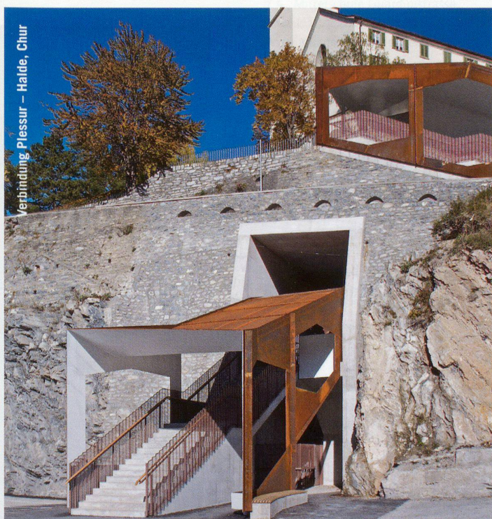
Verbindung Plessur – Halde, Chur

Stuttgart, Weissenhof Linie Fläche Volumen Architektur an Schulen 19. 4. bis 6. 5. www.weissenhofgalerie.de