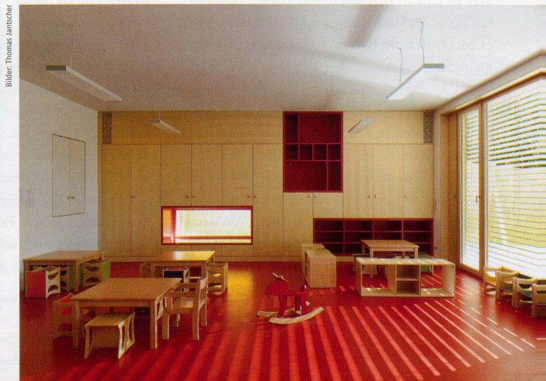
Bilder: Thomas Jantcher