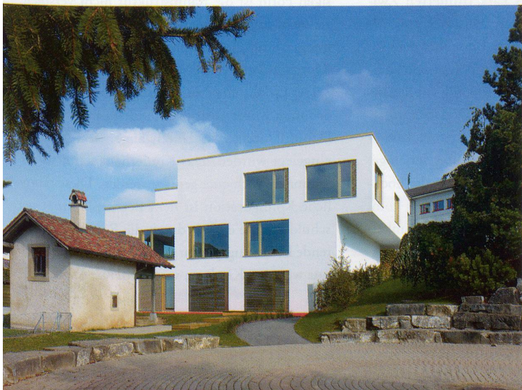
Espace pour enfants in Attalens: Westfassade und Kinderkrippenraum im Gartengeschoss

In ihrer Massstäblichkeit wirken die grossformatigen Öffnungen – jeweils bestehend aus flächiger Festverglasung, Fensterflügel und Lüftungsschlitz – zunächst befremdlich, wenn man die Kinder dahinter beim Spiel ausgestellt sieht. Sobald aber der Kirchturm vom Pausenhof aus durch die Eckbefensterung der Kita zu erkennen ist und umgekehrt, von Innen gesehen, hinter den Giebeln von Attalens der Mont Pèlerin aufragt, versteht man das Haus als Teil des ganzen Gefüges und der Umgebung. Das Dorf und die Landschaft werden sowohl gerahmt als auch dem Gebäude eingeschrieben. Dennoch handelt es sich hier nicht um einen Landkindergarten. Der grösste Teil der Bevölkerung des Dorfs arbeitet auswärts, weshalb man den Ausdruck des Hauses als Verweis auf die