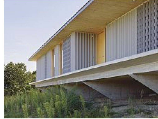
Nordostfassade mit perforiertem Eternit