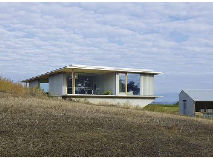
Wohnhaus und Stall von Süden