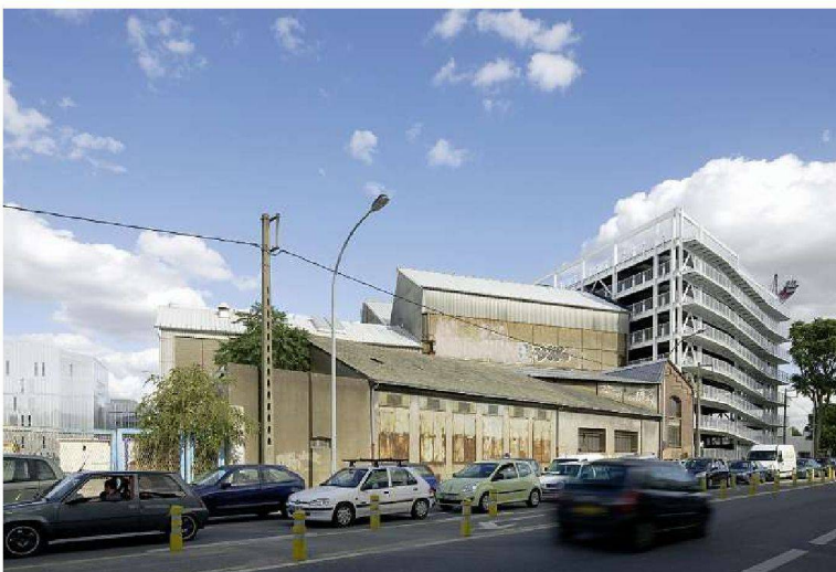
Parking des Machines, Barto + Barto, 2009.

résumé Point de fuite Ile de Nantes Depuis la guerre, Nantes vient de vivre la décennie la plus bouleversante pour son urbanisme. Le cœur de la métropole a basculé vers ce vaste territoire central qui est l'Ile de Nantes, où émergent des nouveaux lieux de polarité qui n'ont pas nié le passé industriel de l'île, mais au contraire l'ont redécouvert, réutilisé et sublimé. A la fin des années 90, l'Ile de Nantes est devenue un concept d'urbanisme forgé par une ville qui tourna le dos au fleuve, lieu d'activités industrielles jusqu'à la fin des années 80. Alors qu'un réseau moderne de tramway transformait la ville, l'Ile de Nantes resta figée – heureusement. Au lieu d'y implanter un quartier d'affaires comme tous les acteurs économiques le souhaitaient, sa transfiguration et sa révitalisation s'est faite de manière différente. Alors que la ville n'a pas échappé à une structuration en étoile de vastes centres commerciaux qui jalonnent la périphérie, le centre ville allait se vider progressivement. L'Ile de Nantes s'est donc vue investie d'une mission de nouvelle centralité au cœur d'une attractivité urbaine renouvelée: l'usine LU, nouvel espace culturel