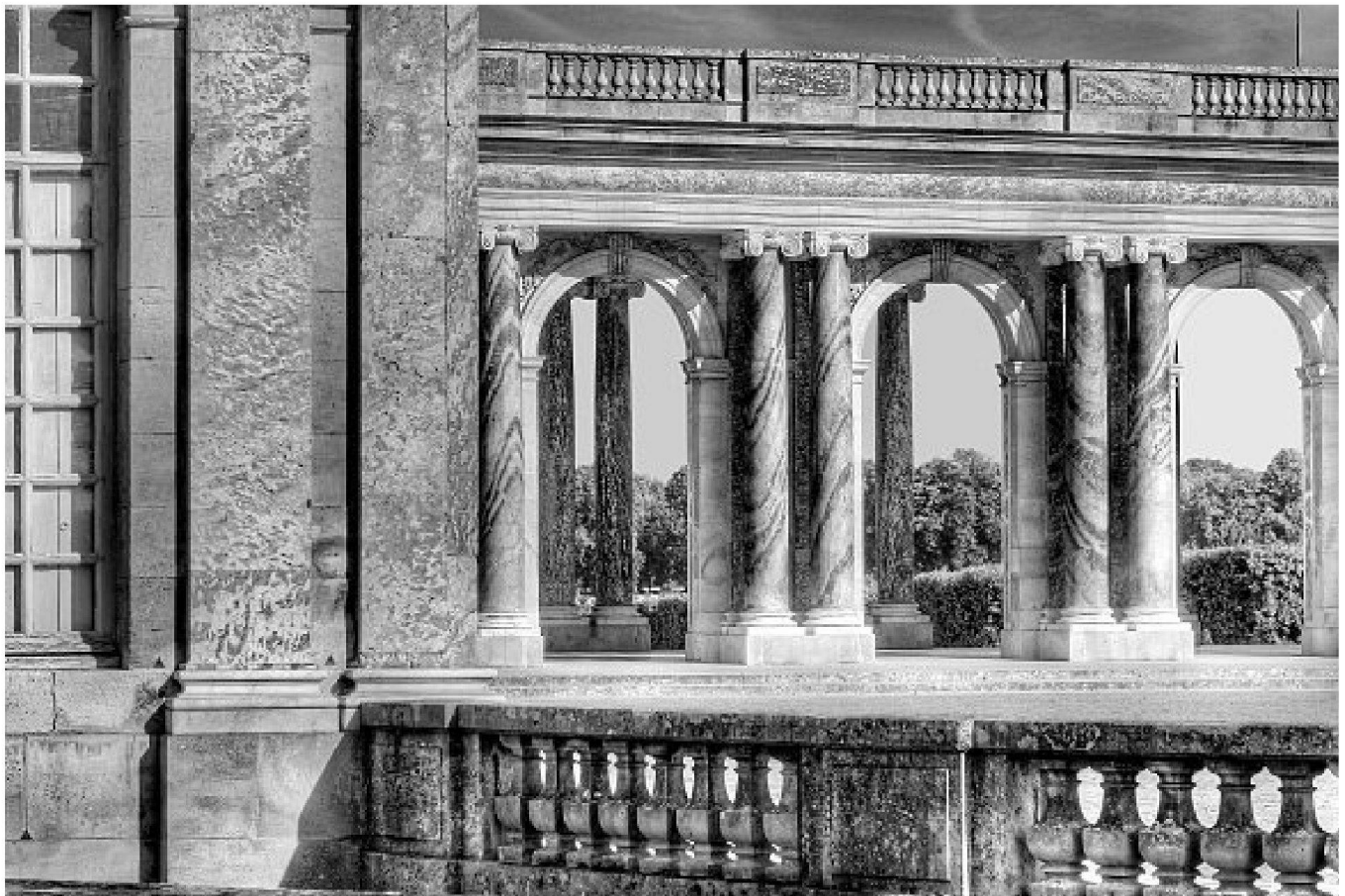
Ein Musterbeispiel eleganter Architektur, aber nur fast (J.-F. Blondel): Der Grand Trianon in Versailles, 1687–88, von François Mansart (Bild aus Le Grand Trianon, Architecture, Décoration, Ameublement, Paris 1908).

Der springende Punkt in der Dichtkunst wie in der Redekunst ist, dass die Eleganz sich niemals den Gebrauch von Zwang zuschulden kommen lässt; & dass der Dichter darin, wie in allem anderen auch, grössere Schwierigkeiten zu überwinden hat als der Redner: denn weil die Harmonie die Grundlage