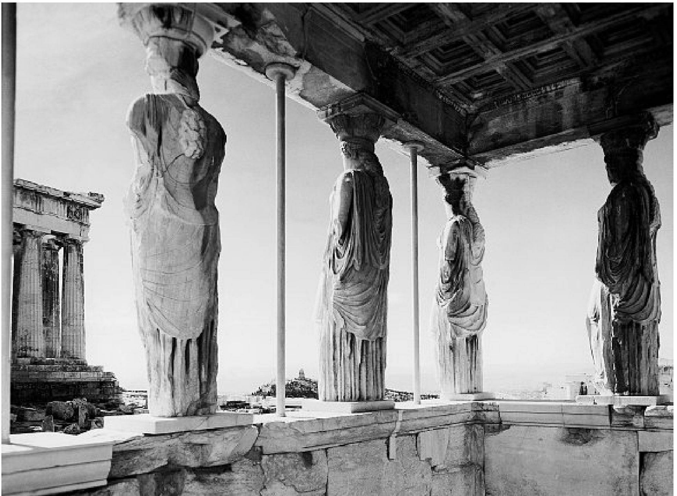
«Prägen sich die Dinge, welche uns schön erscheinen, am leichtesten unserer Intelligenz ein?» (H. Poincaré). Die Karyatiden des Erechtheion.

wirklich, je klarer wir die Gesamtheit mit einem Blick übersehen, desto besser bemerken wir die Analogien mit anderen, benachbarten Objekten, desto mehr haben wir folglich Aussicht, die möglichen Verallgemeinerungen zu erraten. Das Gefühl der Eleganz kann dadurch bedingt sein, dass wir unerwartet Objekten begegnen, die man für gewöhnlich nicht antrifft: hier ist sie fruchtbar, weil sie uns bis dahin unerkannte Verbindungen aufdeckt; sie ist selbst da fruchtbar, wenn sie sich nur aus dem Gegensatz zwischen der Einfachheit der Mittel und der Zusammengesetztheit des gestellten Problems ergibt; sie veranlasst uns alsdann über die Ursache dieses Gegensatzes nachzudenken, und oft genug zeigt sie uns, dass diese Ursache nicht zufällig ist und dass wir sie in irgendwelchem nicht erwarteten Gesetze finden. Kurz, das Gefühl der mathematischen Eleganz ist nichts anders als die Befriedigung, welche uns eine gewisse Übereinstimmung zwischen der gefundenen Lösung und den Bedürfnissen des Geistes bietet, und auf Grund dieser Übereinstimmung kann uns die Lösung als neues Werkzeug dienen. Darum ist die ästhetische Befriedigung mit der Ökonomie des Denkens eng verbunden. Henri Poincaré, Wissenschaft und Methode, Leipzig 1914, S. 20–21.