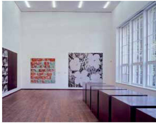
Ausstellung in der ehemaligen Bibliothek

so raffiniert in ein traditionell detailliertes Interieur integriert, dass am Ende das faszinierend unsichtbare Projekt nur mit detektivischer Akribie dechiffrierbar wird.