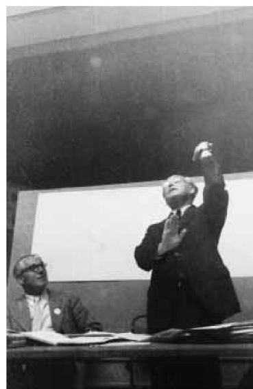
Sigfried Giedion am CIAM-Kongress in Bridgwater 1947.