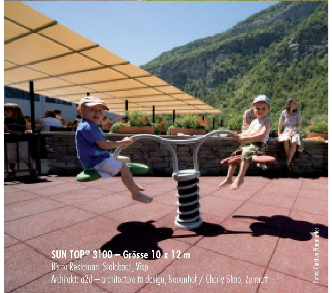
SUN TOP® 3100 – Grösse 10 x 12 m Bistro Restaurant Staldbach, Visp Architekt: a2d – architecture to design, Neuenhof / Charly Shop, Zermatt