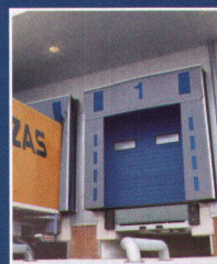
Industrie-Sectionaltor mit Ladebrücke und Torabdichtung

Der bietet Ihnen zum Beispiel die neuen, besonders sicheren und wirtschaftlichen SoftEdge-Tore mit integriertem Anti-Crash-/Anfahrerschutz. Dazu Ladebrücken, Torabdichtungen, Vorsatzschleusen und Industrietore – alles aus einer Hand, perfekt auf- einander abgestimmt.