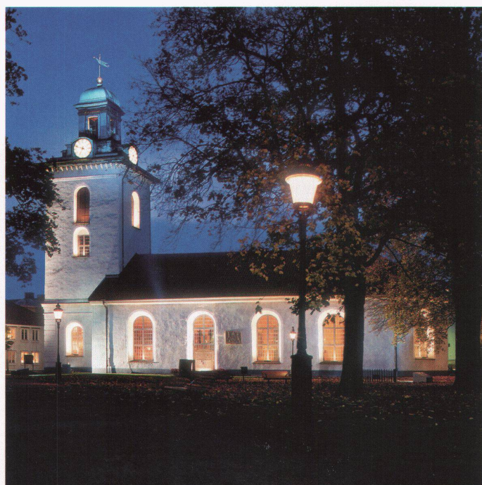
Die Kirche in Alingsås wurde äusserst sensibel gestaltet. Eine dezente Grundbeleuchtung der Fassade wurde ergänzt durch eine Akzentuierung der Fenster, die eine Tiefe bewirkt. Der Turm wurde durch blaues Licht hervorgehoben. Gewöhnlich ist die Kirche mit Natriumdampflampen flächig beleuchtet (Bild oben). Workshop 2000 in Alingsås, Leitung: Roope Siirainen.