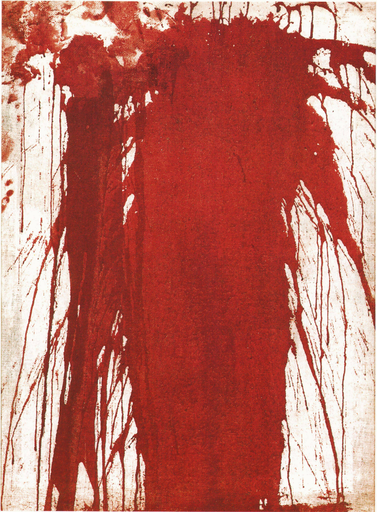
Hermann Nitsch, Kleines Schüttbild, 1962, Dispersion, Schlammkreide auf Jute, Galerie Fred Jahn, München – Bild aus: Nitsch, das bildnerische Werk, Salzburg 1988.