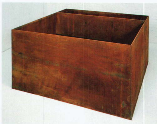
Donald Judd, Ohne Titel (DJ 89-3), 1989. – Bild: Waddington Galleries, London

Naturwissenschaften gehen von einer «Wahrheit» aus, die auf reiner – d. h. vom Menschen und seiner Unvollständigkeit unabhängiger – Logik beruht, die «gelesen» und «erkannt» werden muss. Die Gesetze dieser Wahrheit werden als vorgegeben begriffen, werden aber in Wirklichkeit oft erst durch die Forschungsmethode und im Labor hergestellt. Eine solche Vorstellung von «Reinheit» der Wissenschaft, die Berechenbarkeit und «Lesbarkeit» impliziert, ist ein Spezifikum des abendländischen Denkens, hinter dem nicht nur ein Universalitätsanspruch, sondern auch eine Definitionsmacht über das «Wahre» und «Wirkliche» steht. Das heisst, hinter der Behauptung einer «Reinheit der Wissenschaft» scheint ein Ideal der Vereinheitlichung auf, bei der die Reinheit zur Einheit aller Individuen führen soll.