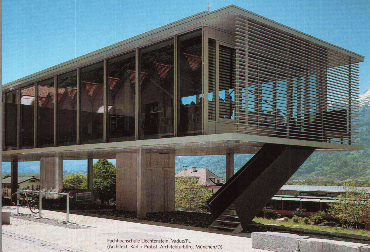
Fachhochschule Liechtenstein, Vaduz/FL (Architekt: Karl + Probst, Architekturbüro, München/D)